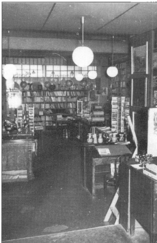
Boghandelen omkring 1957. Bemærk det i artiklen omtalte Ibsen porcelæn, der siden er blevet samlerobjekter.

Så med et var det ovre. Lukketid. Freden sænkede sig. Det var jul, men inden de trætte medarbejdere drog hjem, tog far afsked med hver enkelt med et håndtryk, en varm tak for indsatsen, og med overrækkelsen af konvolut-