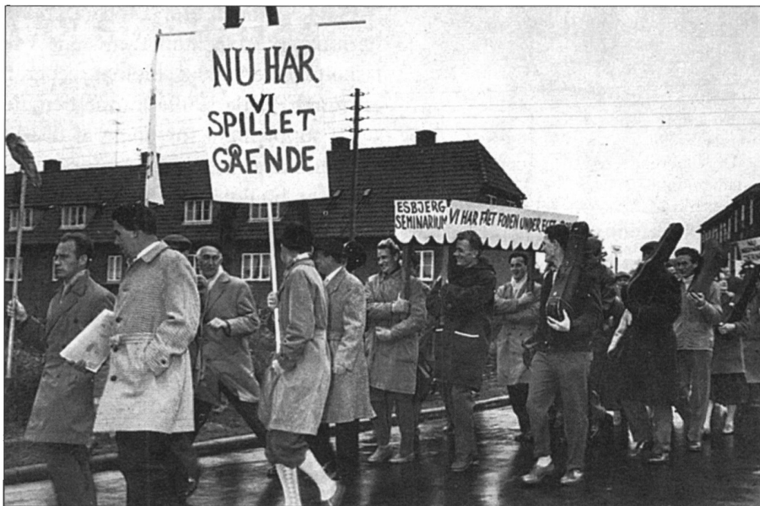
Indflytningen i det nye seminarium fandt sted under megen hurtlumhøj. I procession gik lærere og studerende fra Rørkjær Skole, der ses i baggrunden, til Storegade.

eleverne blev studerende. Dagseminariet omfattede både den fireårige læreruddannelse og den treårige linie for studenter. Antallet af elever var så stort, at der blev behov for egne og egnede lokaler til seminarium. Esbjerg Kommune tilbød at opføre seminariebygninger i tilknytning til Jerne Skole, lokaler som seminariet skulle leje af kommunen. I 1958 flyttede seminariet ind i Storegade 182 i de bygninger, der i dag er hjemsted for Den Sociale Højskole.