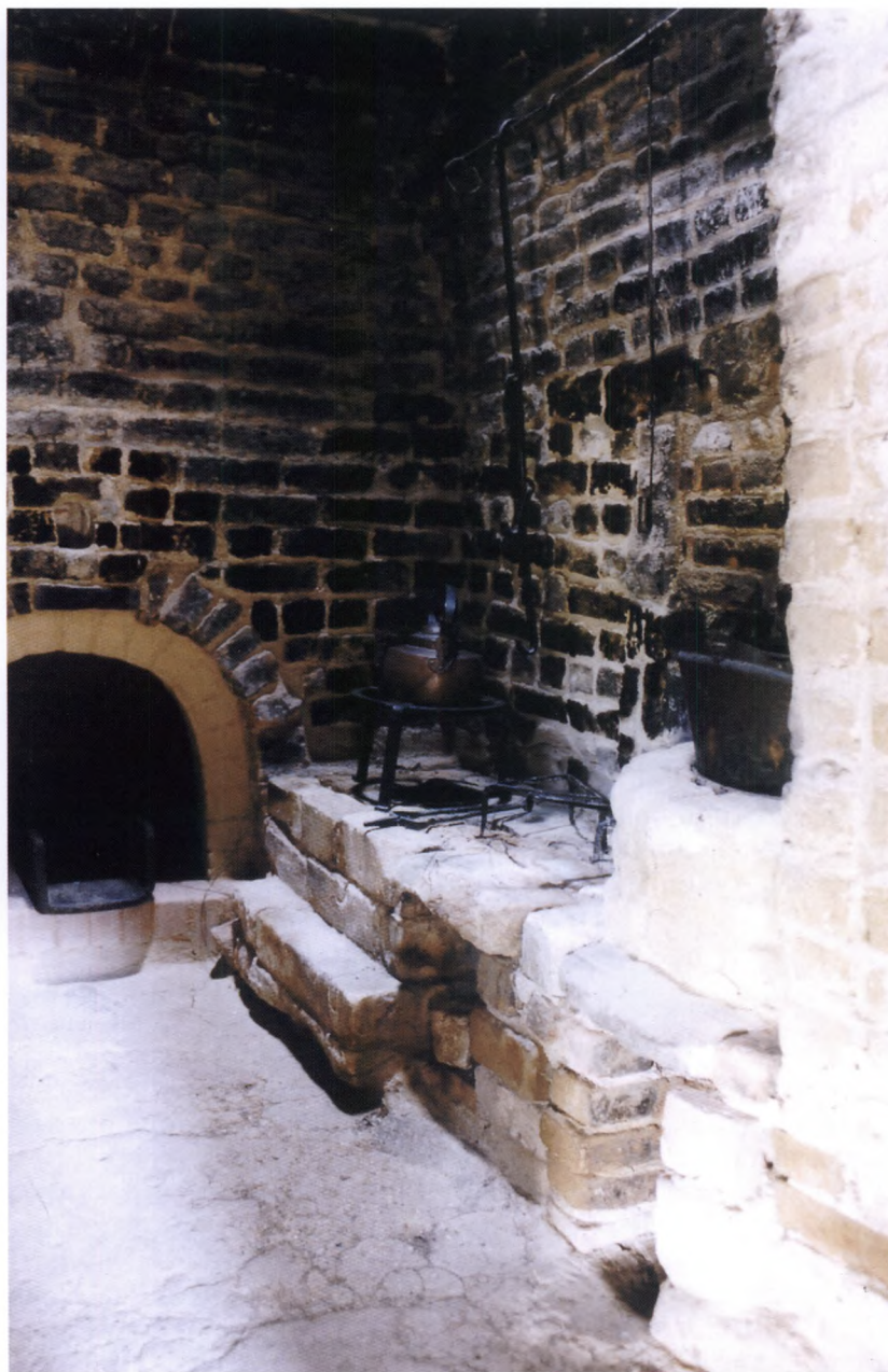
Fig. 2. Sparsomt indrettet køkken. Køkkenet var på sjællandske gårde placeret direkte i den store skorsten. På ildbænken ses bl.a. en ildtang og en trefod. Oven over hænger en grydekrog. Bageovnen ses indfyringen til bageovnen højere oppe. Varmen fra bilæggerovnen i stuen blev holdt ved lige fra køkkenet (location: Frilandsmuseet).

Disse få eksempler viser, at der kunne være større eller mindre variationer i gårdenes indbo mellem forskellige lokaliteter inden for et forholdsvis lille geografisk område. Nogle af forskellene kan henføres til forskellige fysiske vilkår, andre må søges i forskellige kulturelle traditioner.