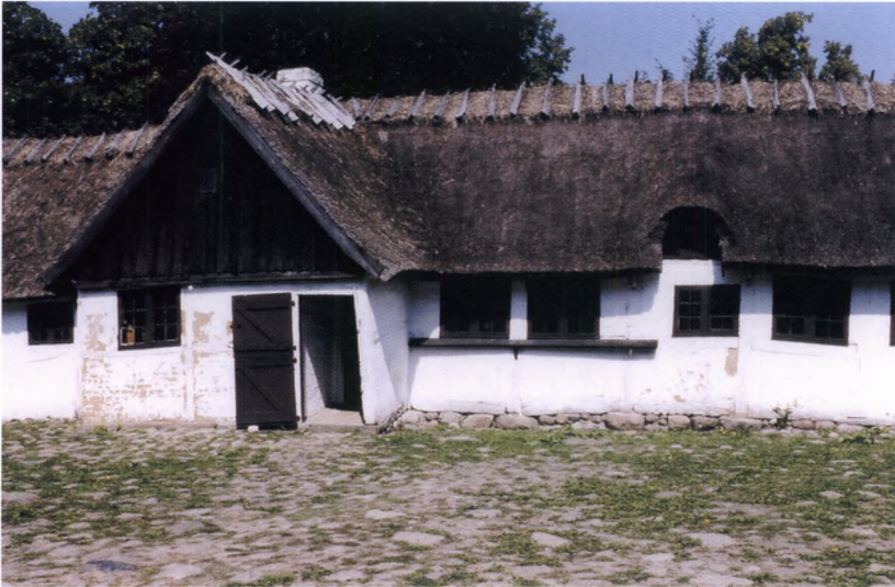
Fig. 3. Stuelænge af sammenbygget fir-længet gård fra det østlige Midtsjælland, som den så ud ca. 1800. Stuevinduerne ses til højre for indgangen (location: Frilandsmuseet).

de mindste gårde var der blot en stue og et køkken, mens der på den største gård var stue, køkken, to kamre, et mindre kammer og et drengeskammer. Sammenligner vi antallet af registrerede genstande fra gårdene, varierer mængden fra 64 til 218. Det var ikke den mindste og største gård, som havde henholdsvis 64 og 218 genstande. Faktisk havde de to mindste gårde med kun to beboede rum henholdsvis 92 og 100 genstande, mens den største gård med seks beboede rum til sammenligning kun havde 129 genstande. Der er således ikke umiddelbart nogen sammenhæng mellem antallet af rum og antallet af genstande. En lille gård kunne have mange ting, mens en stor gård kunne være sparsomt indrettet og udstyret.