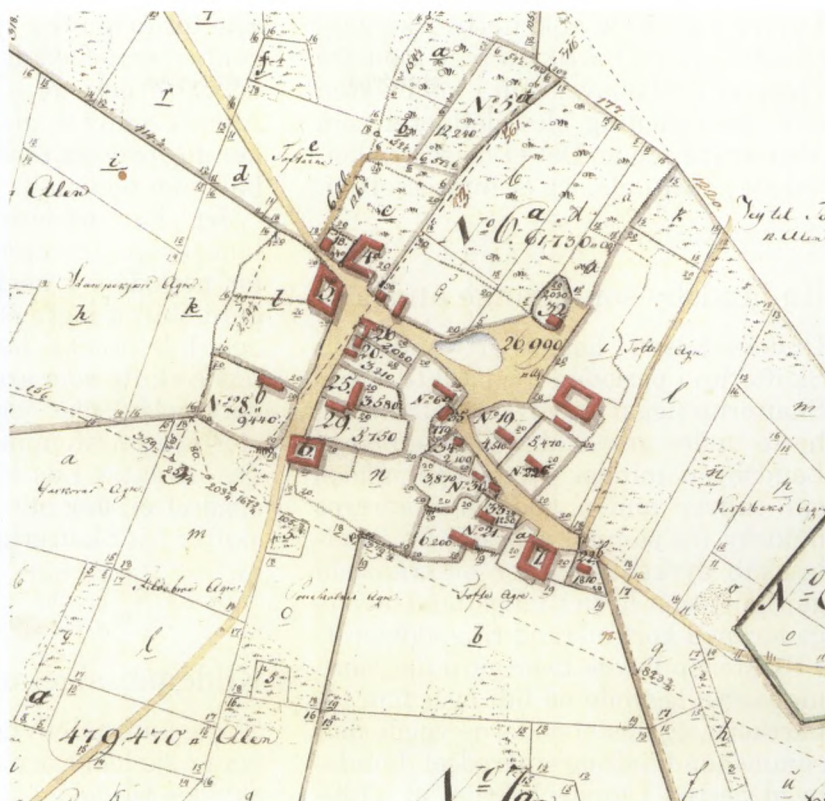
Fig. 1. Skafterup landsby før udskiftningen i 1798. I forhold til mange af de øvrige landsbyer under Holsteinborg gods, var Skafterup en forholdsvis stor landsby. Fra landsbyen udgik vejene mod syd til Bisserup med 15 gårde, mod nordvest til Nyrup med fem gårde, mod øst til Spjellerup med 11 gårde og mod nord til Tornemark med 17 gårde. Rundt om landsbyen lå markerne, som blev dyrket indenfor fællesskabets rammer (Matrikelarkivet: Skafterup byes jorder 1798).

former. Sagt på en anden måde kan ændringen i fokus formuleres som en undersøgelse af levevis frem for konkrete levestandarder . De forskellige kulturelle udtryksformer ses som et udslag af ikke bare forskellige fysiske og økonomiske betingelser, men også af et forskelligt socialt-, traditions-, og interesseremæssigt tilhørsforhold.