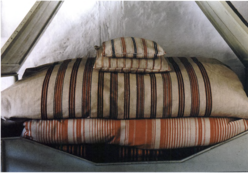
Fig. 6. Dyner og puder i forskellige typer striber og farver lagt til skue i en udtræks-seng (location: Fri-landsmuseet. Foto: Louise Mengers).

den for de primære aktivitetsfelter, mens de bønder, som ofte deltog i det sekundære aktivitetsfelt også var dem, der blev påvirket af modestrømninger, nye idéer og lignende, fordi de havde mange udadvendte kontakter. Det var imidlertid ikke ligegyldigt hvilken form for aktivitet, der foregik i det sekundære felt i forhold til de relationer, som havde betydning for den kulturelle diffusion. Hanssen skelner mellem det, man kunne kalde en åben og lukket form for kontaktrelationer. De lukkede former foregik mellem bønder og håndværkere, bissekræmmere osv. og medførte ikke højfrekvente kontakter. Handelen her foregik ofte ved varebytning. Bonden medbragte korn og fik andre varer i bytte. De åbne former foregik på markeder med livlig kreaturhandel. Denne handel skabte højfrekvente relationer mellem urbane og pagane mennesker: »Hermed ses ikke blot at markedet udgjorde et brændpunkt for kontakterne mellem urbane og pagane mennesker, men også at det i de analyserede tilfælde formidlede vareudvekslinger fra urbane produktionsenheder til pagane konsumenter«. 34 En af årsagerne til