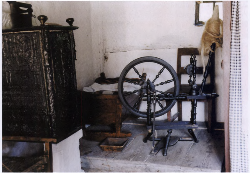
Fig. 4. Krogen mellem bilæggerovnen og en seng blev ofte brugt som spindeplads. Her ses desuden en vugge (location: Frilandsmuseet).

den sengetid. Her strikkede, spandt og kartede kvinderne, mens mændene f.eks. reparerede og udbedrede småskader på redskaberne. 18 Stuen var også gårdfamiliens ansigt udadtil. Det var her naboer eller fremmede blev budt ind og opvartet, alt imens de skabte sig et indtryk af familien på gården gennem de ting, som stod i stuen. Det var således ikke ligegyldigt hvad man så, når man kom ind i bondens stue. Der var knyttet status og social prestige til meget af stuens inventar. Ved at fokusere på forskellene i indboet mellem de enkelte gårde, får vi indtryk af bredden i den materielle kultur, inden for hvilken bønderne markerede status og tilhørsforhold gennem fysiske symboler.