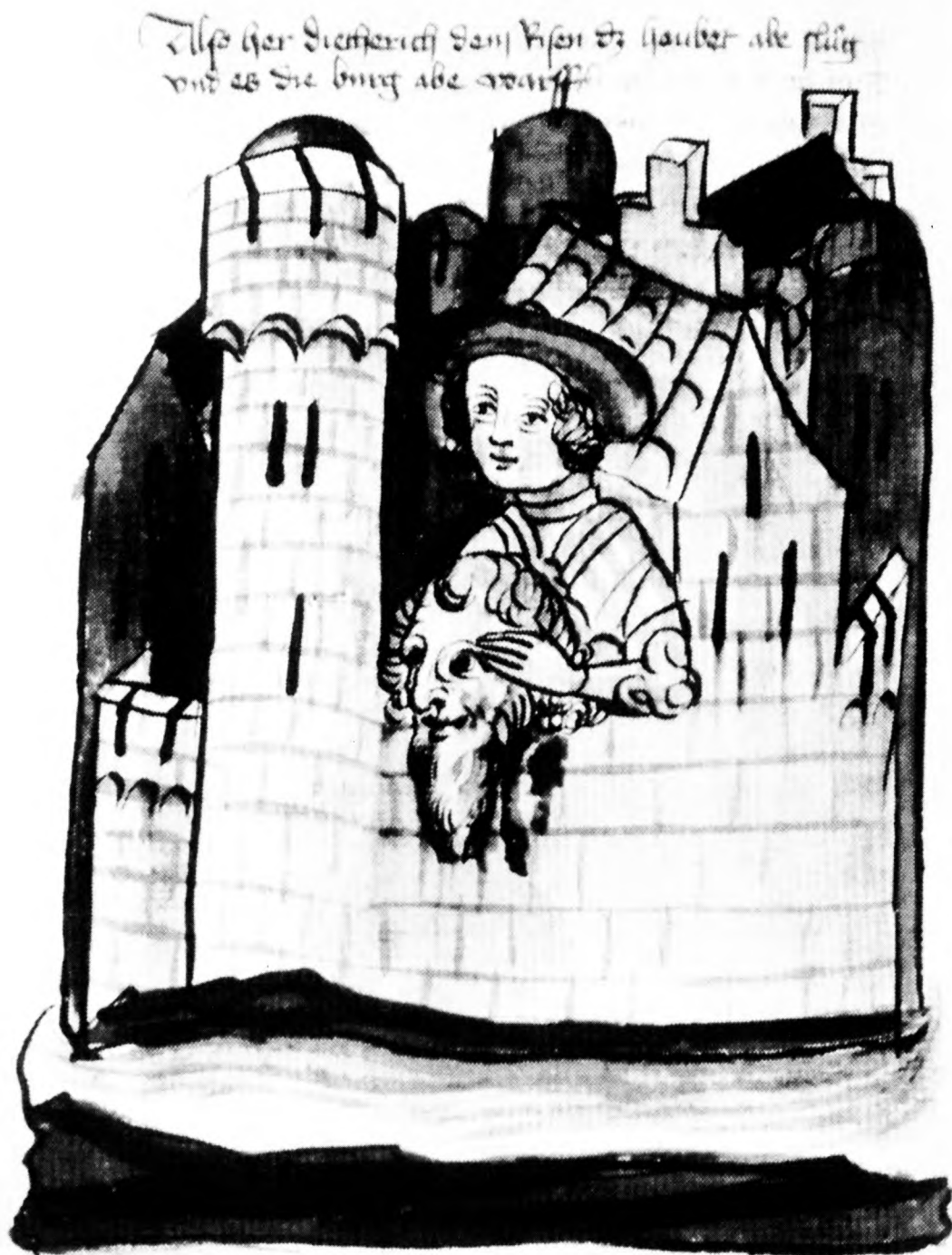
Figur 6. Didrik af Bern er sagnetes spejlbillede af østgoternes berømte konge Theoderic (474/75-526). Bern vil sige Verona, regeringsby i Det østgotiske Rige. Didrik er en forvrængning af Theoderics navn, der igen er en sammenstilling af thiudan (folk) og reiks (konge). Theoderic var således på én gang »sakralkonge« (thiudan) med religiøse og politiske funktioner og samtidig »hærkonge« (reiks). Reiks og rex – og dermed »regent« – har således direkte forbindelse med de germanske kongers funktion som krigsherrer (Træsnit fra 1400-tallet, gengivet efter Armin Tuulse m.fl.: Gotlands Didrek, 1978, s 125).