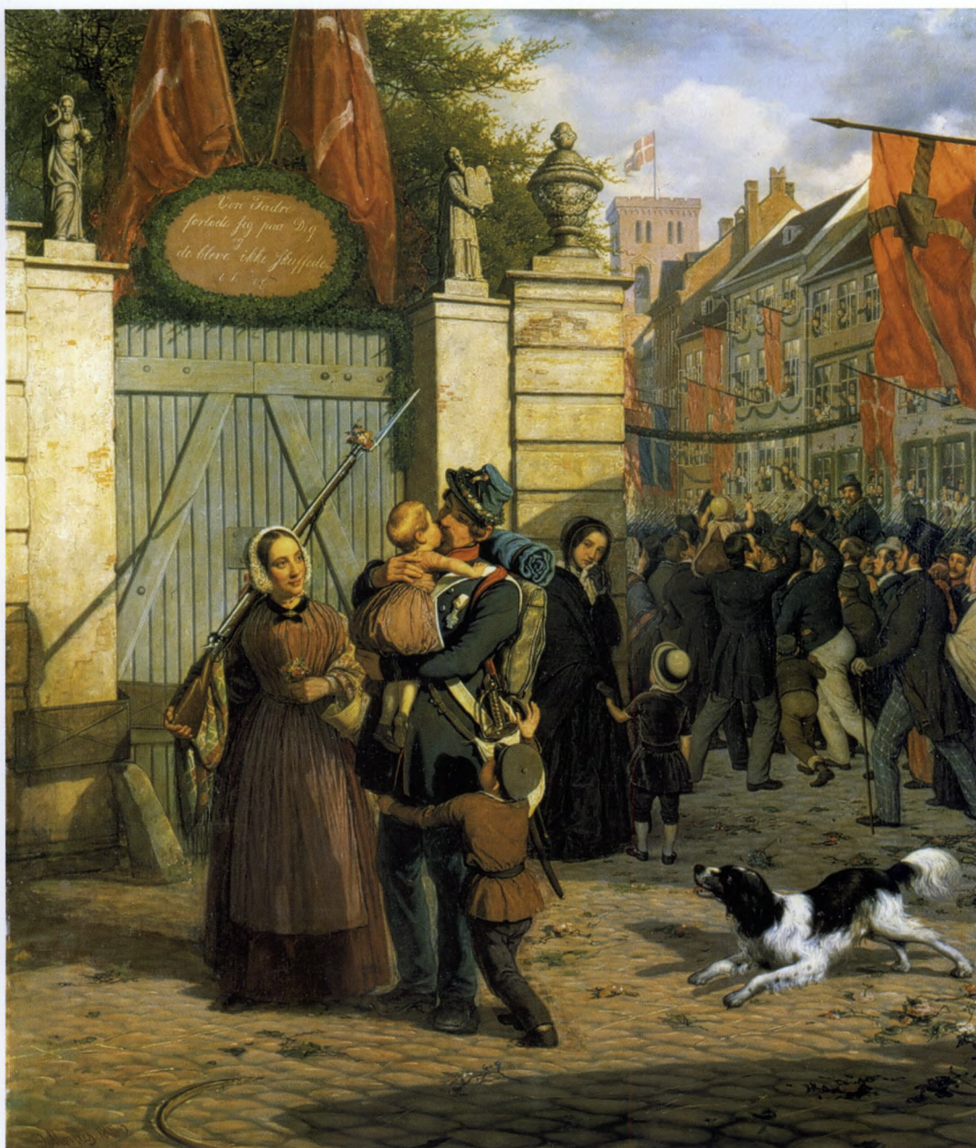
Figur 5. På David Monies maleri »Episode fra soldaternes hjemkomst i septemberdagene 1849« (1850) genser en soldat sin kone og to børn ved porten til Helligåndskirken i København. At krigen ikke endte lige lykkeligt for alle understreges af den sortklædte enke, der med tårer i øjnene overværer den lykkelige genforening. Monies maleri bidrog til at udbrede den farlige og skæbnesvangre myte om, at Danmark kom sejrrigt ud af krigene 1848-50 alene i kraft af egen styrke og dygtighed. (Det nationalhistoriske Museum på Frederiksborg Slot).

hørte under samme stat: den danske helstat må Treårskrigen derfor karakteriseres som en borgerkrig. Når histo-