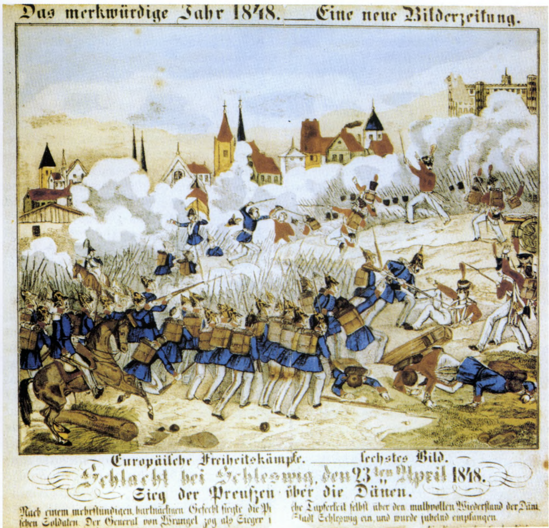
Figur 4. Slaget ved Slesvig den 23. april 1848. I slaget tørnede danske tropper sammen med preussiske styrker, der var Slesvig-Holstens allierede. Litografiet af Gustav Kühn blev masseproduceret og udbredt over hele Tyskland. Derved har det været med til at danne manges bevidsthed om denne konflikt, der i Tyskland blev betragtet som en befrielseskamp mod Danmark.