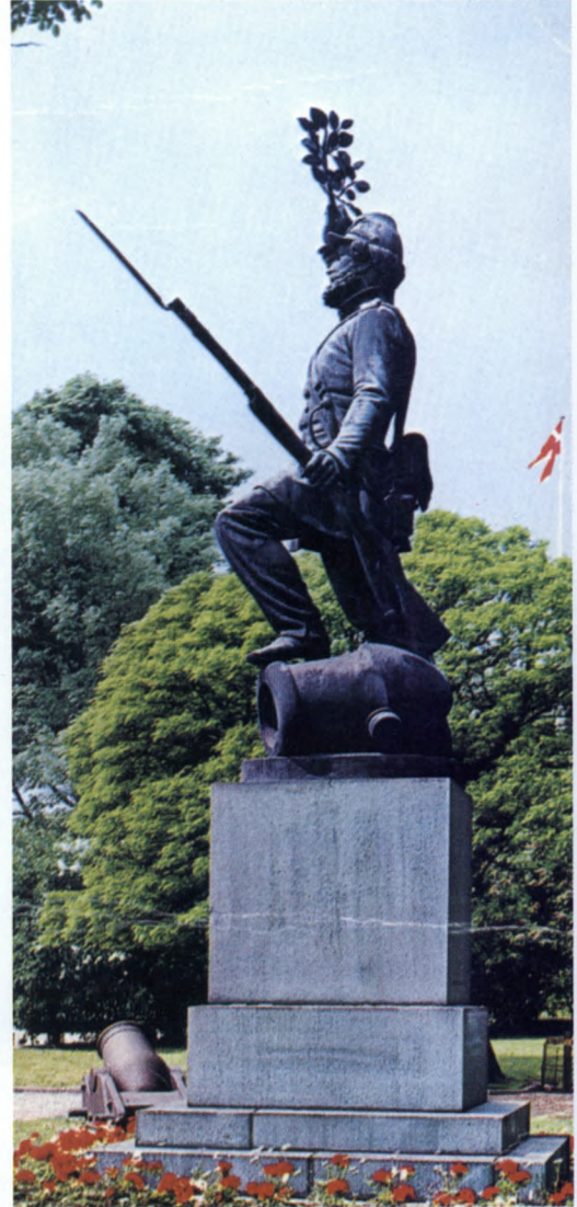
Figur 6. H.W. Bissens statue af den tapre landsoldat blev afsløret i Fredericia 6. juli 1858 på 9-årsdagen for det sejrige danske udfald fra byen. Monumentet bidrog til at skabe og vedligeholde den myte, at Danmark havde vundet Treårskrigen 1848-50 ved egen våbenlykke. (Postkort i Fredericia Museum).

Selv om kongeriget ved flere lejligheder gik af med sejren under borgerkrigen, så var det dog stormagternes