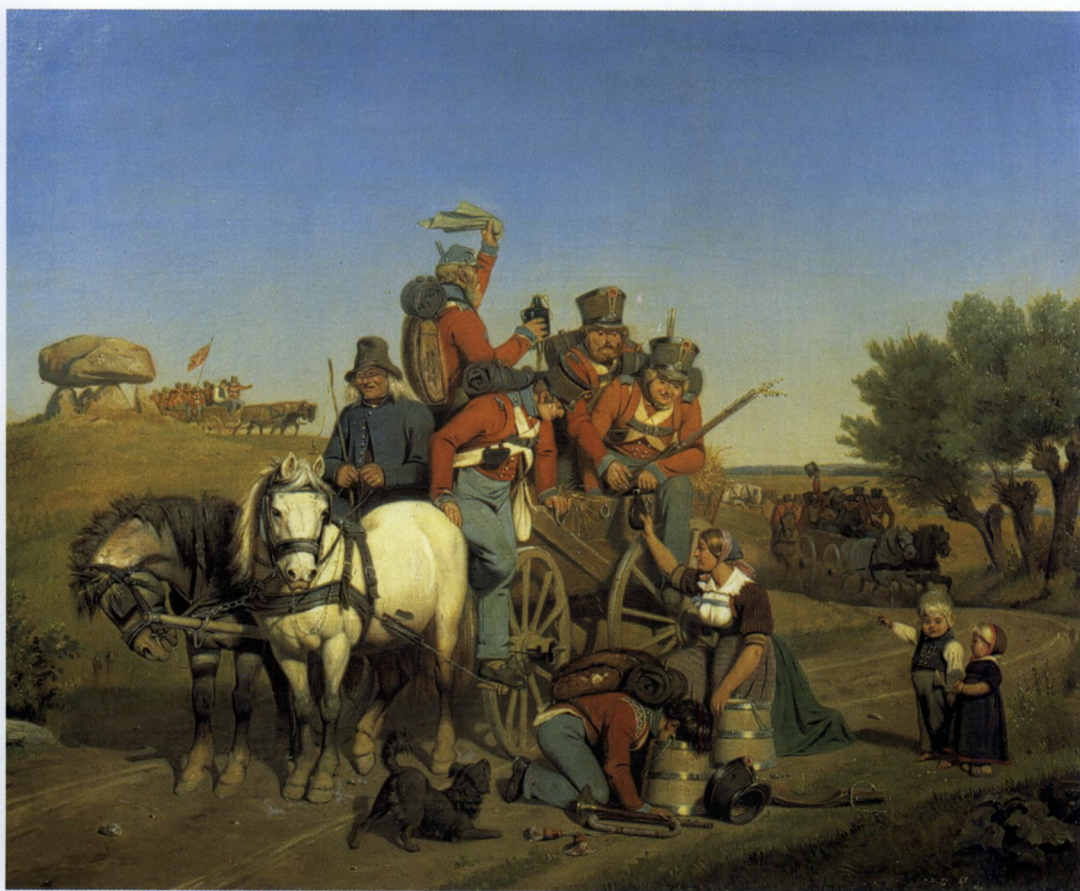
Figur 1. Nikolaj Habbes maleri »Reservesoldater på marchen 1848« (1851) blev hurtigt en klassiker, når man skulle udtrykke »ånden fra 1848«. Soldaterne, der er fulde af patriotisme og kampiver, får under et holdt på vej til borgerkrigen i Slesvig-Holsten gratis forfriskninger af en bondekone. At vi her står over for afgørende og måske skæbnesvangre begivenheder, signalerer Habbe med den lille dreng, der tydeligt gør beskueren opmærksom på, at man her er vidne til noget stort og vigtigt. (Det nationalhistoriske Museum på Frederiksborg Slot).

det hidtidige danske styre allerede før Christian 8.'s død den 20. januar 1848 havde forberedt et systemskifte, og at »det danske systemskifte foregik uden direkte pres nedefra og i realiteten var afgjort, før det første gny fra Februarrevolutionen nede i Europa nåede Danmark«. 7 Der kan ligeledes konstateres en tendens til at anskue konflikten med hertugdømmerne Slesvig-Holsten og disses støtter fra Det tyske Forbund som en dansk-tysk nationalitetskonflikt, en etnisk borgerkrig inden for helstaten. Dette er sket under indtryk af borgerkrigen i det tidligere Jugo-