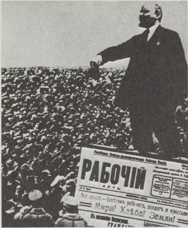
Lenin taler om »Fred, brød, land«. Fotomontage 1928.