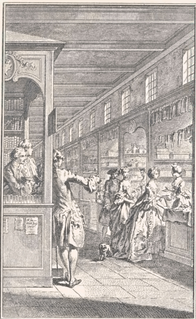
Il Gravelot inv.