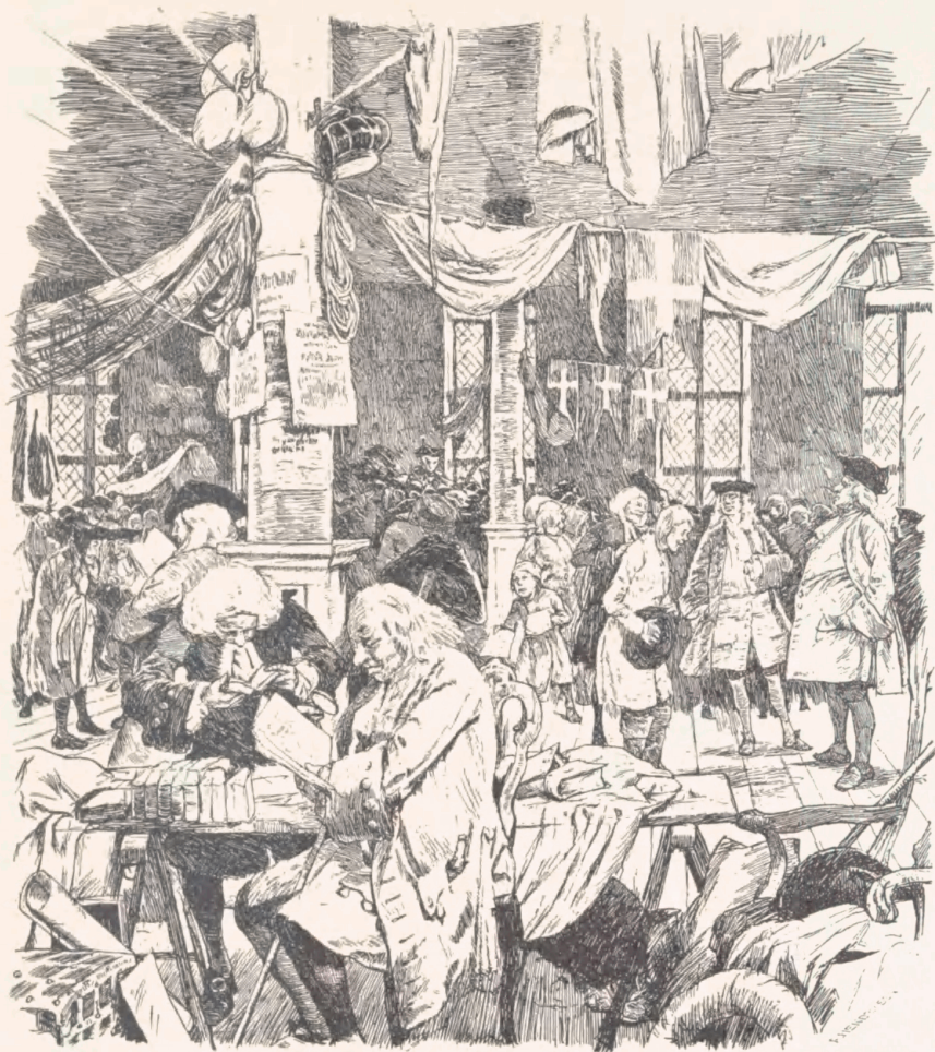
Tegning af Hans Tegner til Holbergs komedie »Den 11. Juni« (i den store Holberg-udgave 1883–88).

Kassebøgerne, der alle er ført på tysk, indledes efter gammel tysk skik med nogle fromme ord: Ist Gott mit uns, wer wird wider uns seyn«. Ved udgangen af 1739 hedder det: