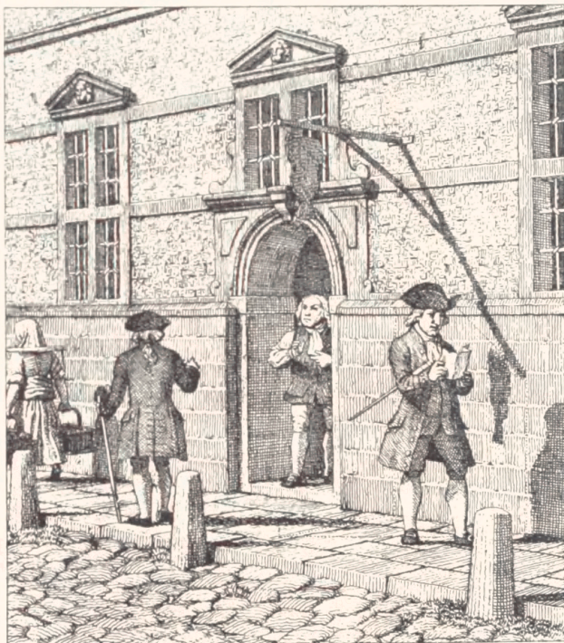
Læsende student foran en af Børsens »kælder-boder«. Tegning af Eckersberg. 1841.

I 1804 blev Schubothe hofboghandler. Han var meget afholdt af sine kolleger, og som indehaver af Børsens ældste boglade og iøvrigt som børs-