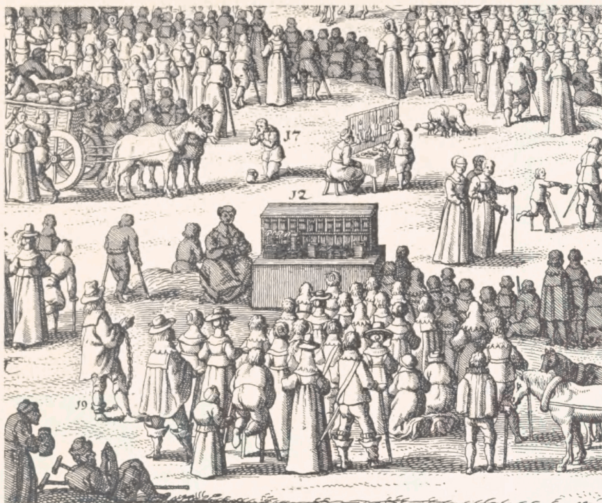
Bogførere med bogbod på marked o. 1645. Kobberstik fra Wagner: Theatrum Europaeum.

lere og forlæggere greb chancen og lejede boder på Børsen. Allerede i 1620erne havde hollandske bogførere falbudt deres bøger i København i et sådant omfang, at de københavnske boghandlere i 1624 klagede til konsistorium over, at de fremmede boghandlere blev i byen »ud over al rimelighed«.