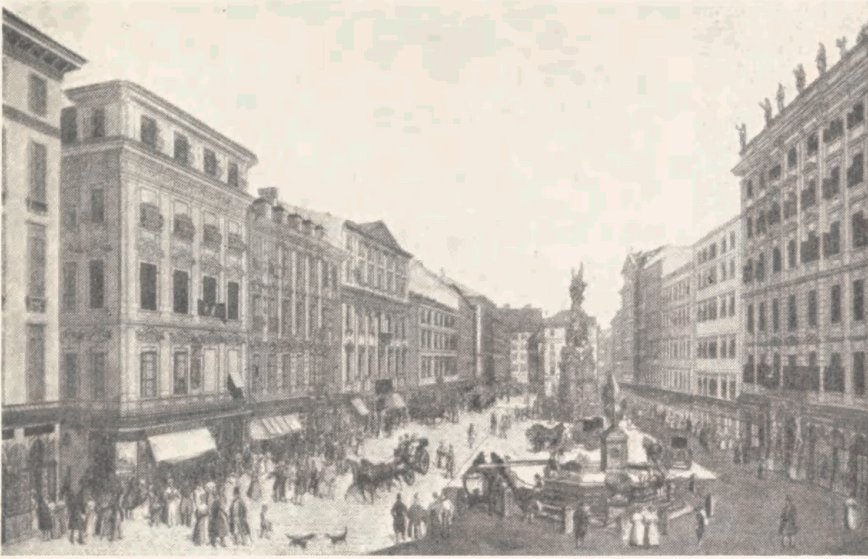
Graben i Wien mod Kohlmarkt 1781 (t.h. Trattnerhof). Efter et koloreret stik af E. Schütz.

med at erklære, at biblioteket skal tjene „den almindelige oplysning, vor menneskekærlige monarks store livsværk “, og slutter med nogle linjer, der kunne være ført i pennen af oplysningskejseren selv: „Oplysning er vort mål, og den løn, vi sikkert regner med, er, at i løbet af nogle år vil læsningen af gode og nyttige bøger i de k. k. stater være almindelig udbredt og bringe rige frugter.“ Trattner kunne sit kram.