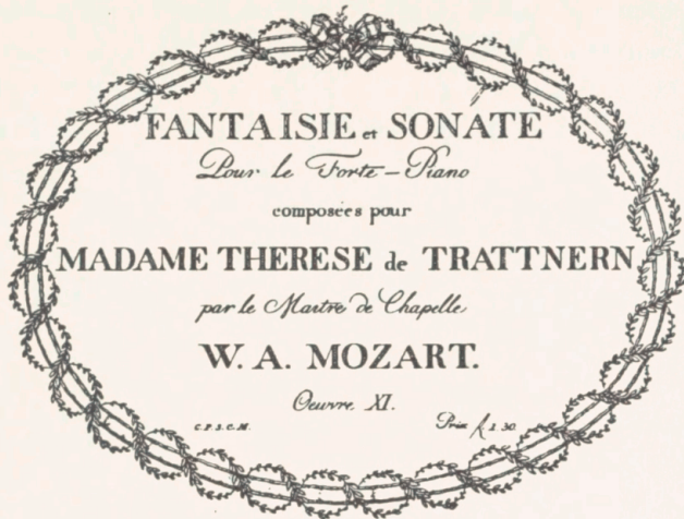
Titelblad til den fru Trattner II tilegnede klaversonate af Mozart.

etagen var der en boglade, som i størrelse og fornemhed overgik alt hidtil kendt. På første sal fandtes et efter fransk forbillede indrettet læsekabinet, over hvis bogbestand der 1777 og 1780 blev udgivet kataloger med flere til-læg. Disse læsekabinetter, der i Tyskland skød op som paddehatte, blev i Østrig af censurmæssige grunde forbudt i 1798. Men længe forinden havde Trattner „mit allerhöchster Erlaubnis“ forvandlet sit til et „Casino für den Adel, charakterisierte und andere Personen von Distinction“.