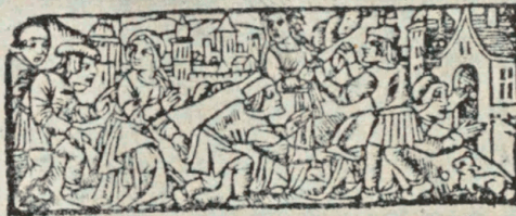
Titelblad til „A Boke of the Propertyes of Herbes“ 1540.