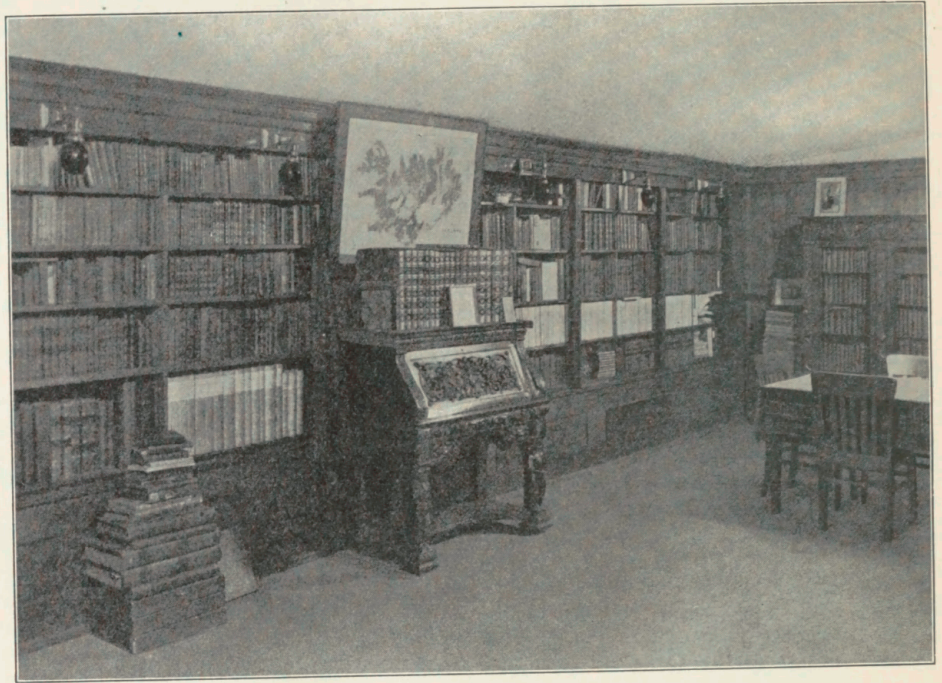
C. H. Thordarsons Samling.