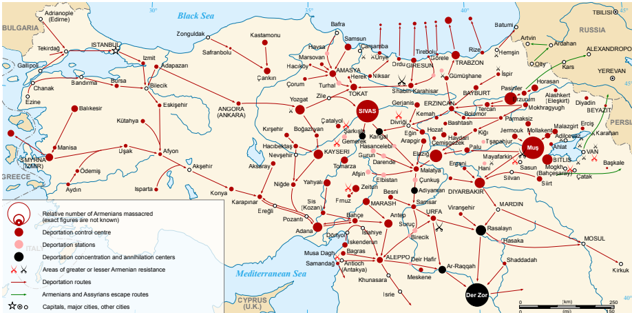
Det armenske folkemord.

frustreret. De ville besvare hårdt med hårdt. Allerede i 1910 havde Enver udtalt til en tysk gesandt, at armenierne, grækerne og assyrerne havde svigtet imperiet, derfor havde de ikke ret til at overleve, og de skulle i hvert fald fjernes fra de områder, hvor de kunne betragtes som en sikkerhedsrisiko, dels fordi de blev betragtet som en femte kolonne for hovedfjenden Rusland, dels fordi de opfattedes som en grisk middelklasse, som berigede sig på de muslimske bønders bekostning, og endelig fordi de lå i vejen for Envers og Talaats store ide om at skabe et sammenhængende tyrkisk-muslimsk "folk hjem" fra Ægæerhavet til Altaj-bjergene i Sibirien, tyrkernes gamle urhjem. En tanke som i øvrigt heller ikke havde været Abdül Hamid 2. fremmed.