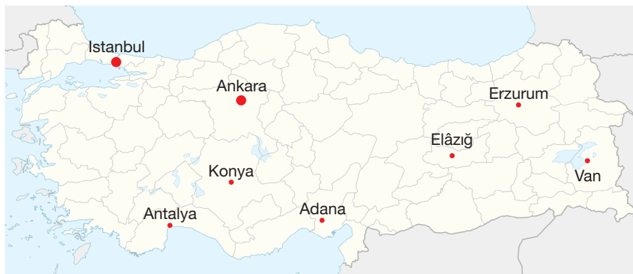
Det moderne Tyrkiet med Elâziğ (det daværende Harput) midt i Østankatolien (Vestarmenien).

Men på Peloponnes flammede opstanden op, ledet af den stedlige græsk-ortodokse biskop af Patras. Især i halvøens bjergegne strømmede oprørerne til. Sultanen i Konstantinopel, Mahmud 2. (1808-1839), blev grebet af panik, og for at berolige ham besluttede patriarken af Konstantinopel højtideligt at fordømme oprøret og mane rigets grækere til trofasthed og lydighed. Men sultanen så i fantasien alle sine kristne undersætter rejse sig mod ham. Han gav ordre til, at patriarken skulle gribes efter påskeliturgen og hænges i patriarkatets port sammen med et par andre biskopper. En lokal bande gik løs på kirken og udførte opgaven, patriarken fik lov til at kvæles langsomt, op-hængt i porten, og bagefter blev hans lig i sit festskrud slæbt gennem byen og ned til Bosporus, hvor det med noget tungt om benene blev smidt i vandet.