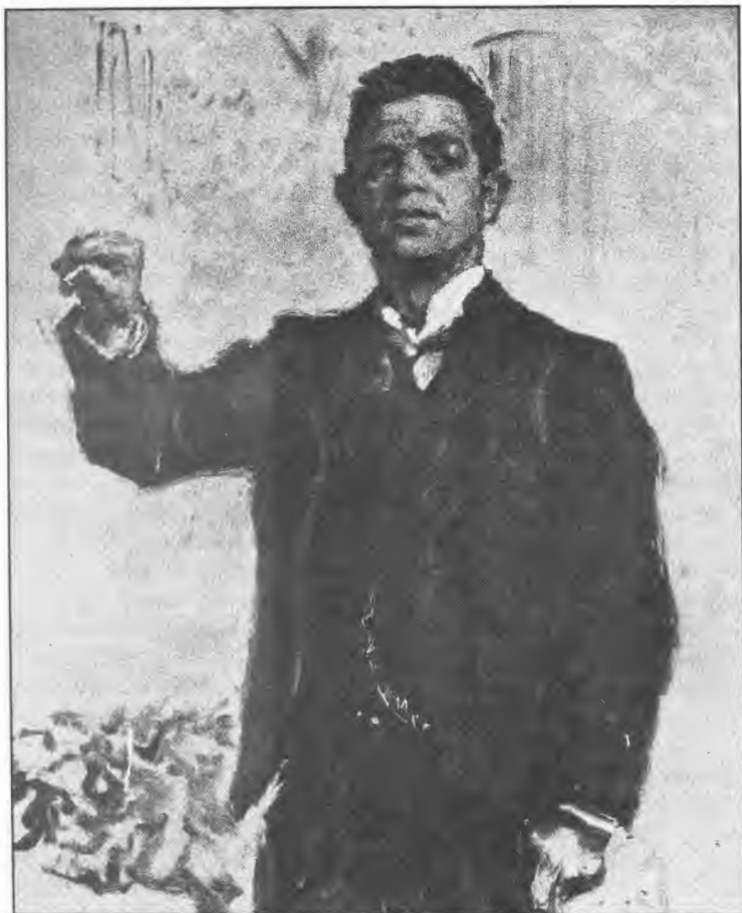
Carl Nielsen. Maleri af Viggo Johansen, 1906. Fra smudsomslaget til Carl Nielsen. Kunstneren og Mennesket.