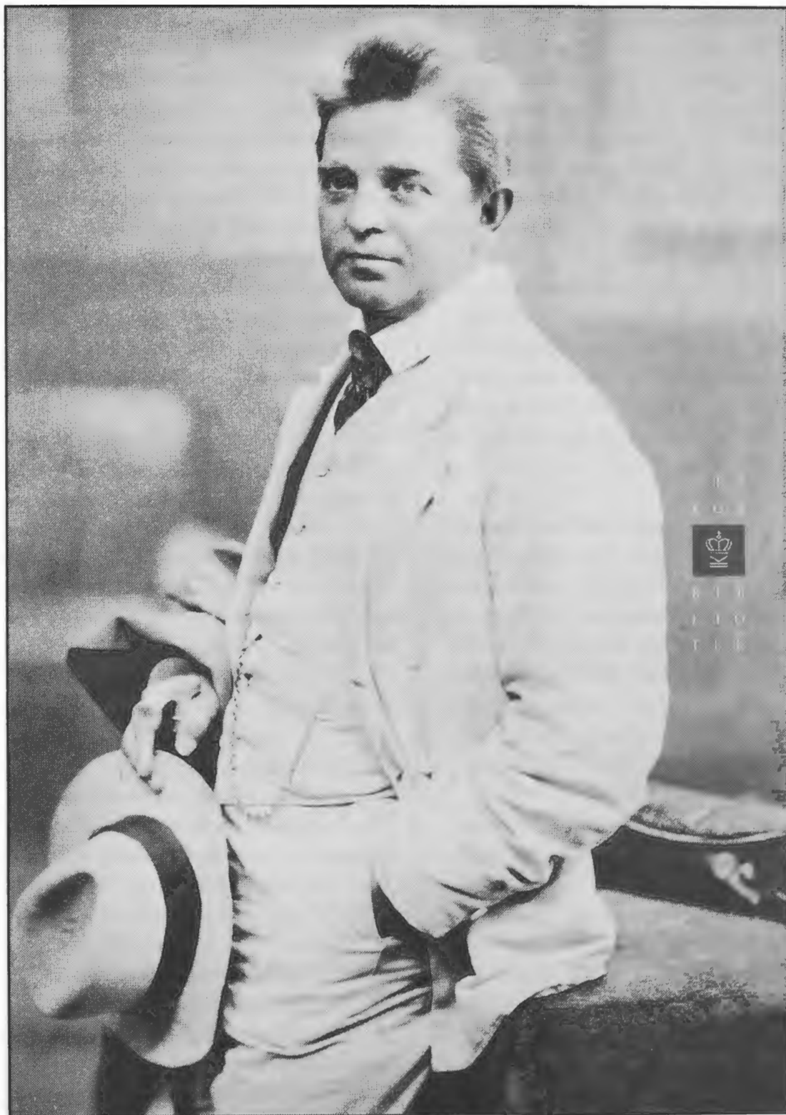
Komponisten Carl Nielsen, 1908. Platin, kabinetsformat. Fot. Georg Lindstrom. Kort- og Billedafdelingen. - Forhandles som plakat (70 x 100) af Det Kongelige Bibliotek. Pris: kr. 100,-