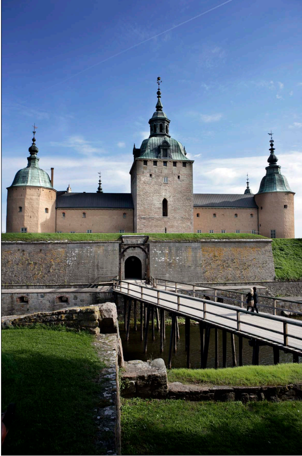
Kalmar Slot, hvor unionsaftalen blev indgået i 1397.