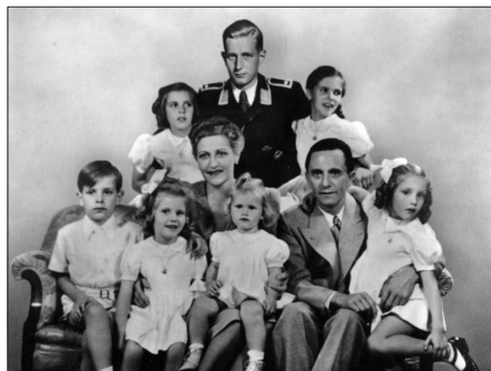
Hele familien Goebbels samlet nytårsdag 1944. Bagest står Harald Quandt, søn af Magdas første ægteskab. Som den eneste på billedet overlevede han krigen.

Der er meget, der tyder på, at Goebbels i de sidste krigsår blev mere kritisk over for Hitler og især over for dennes manglende evne til at træffe beslutninger. “Hvis jeg var fører” var en formulering han i dagbogen brugte i forbindelse med