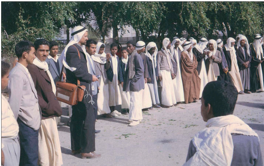
PRO med båndoptager og mikrofon optager musik ved en fest i Bahrain 1962-63. Foto: Kjell Falck. Gengivet efter Music in Bahrain. Traditional Music of the Arabian Gulf, 2002.

musik, han viede sit liv til at undersøge, dokumentere og forsøge på at bevare.