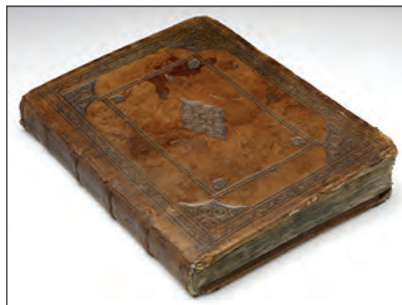
Södermannalagen, indbundet i brunt presset skindbind fra slutningen af 1500-tallet.

I løbet af foråret 2010 var der jævnlig kontakt omkring spørgsmålet om, hvad Danmark kunne give igen for C 37. Den 20. maj kom rigsbibliotekar