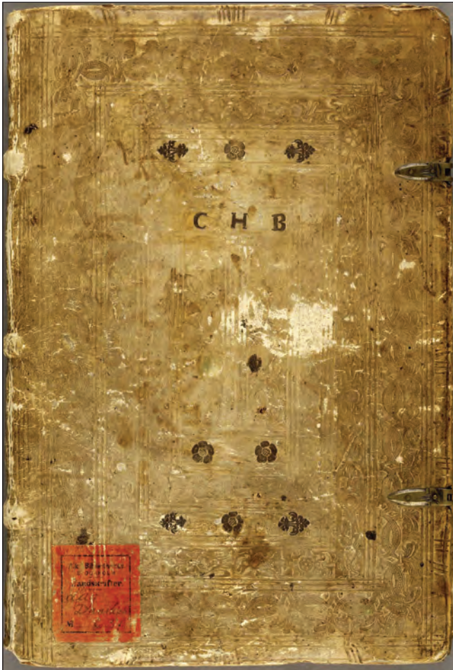
Codex Holmiensis 37 er et samlingshåndskrift, bestående af 3 dele, der antagelig 1580 er blevet samlet i ét presset læderbind over træsideflader og med flere roskenrammer. På bindets forreste perm er indpræget bogstaverne CHB og på bageste perm årstallet 1580.

for en evt. tilbagelevering af Jyske Lov. Ved samme lejlighed bad jeg ham om at tage kontakt til direktøren for Kungliga Biblioteket i Stockholm med henblik på uformelt at drøfte problemstillingen. Direktøren for Det Kongelige Bibliotek har meddelt mig, at han har indledt drøftelserne om en mulig tilbagelevering af Jyske Lov med sin svenske kollega. I drøftelserne, hvor en tilbagelevering i form af bytte også er på tale, er således taget de indledende skridt til, hvordan