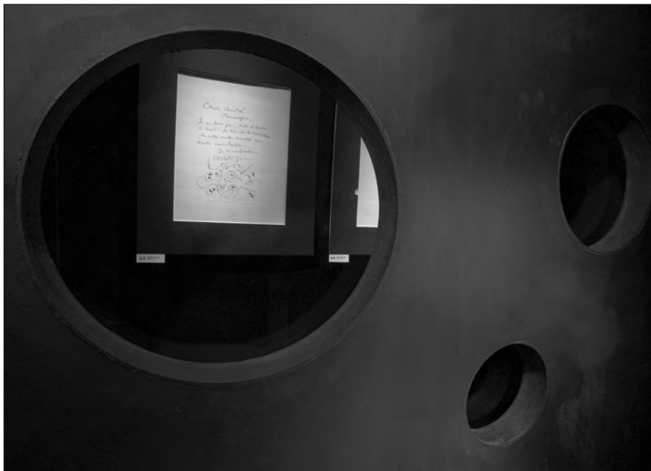
Robert Wilson lader os kigge på skitsebøgerne gennem små bitte kighuller. Så sker der noget andet, end vi er vant til. Så sker der noget interessant – også i forhold til de bøger, der udstilles. Godt nok kan man ikke se på bogene uforstyrret, som hvis de stod på rad og række i montrere, men via kighullerne formår Wilson at fortælle noget andet om skitserne. Noget om intimiteten og det personlige, der kan gemme sig bag disse tegninger.

også debat om, hvad vi kan tillade os i formidlingen af kulturarven, og om der bliver gået på kompromis med fagligheden, når kunstnerne på den måde får frit spil.