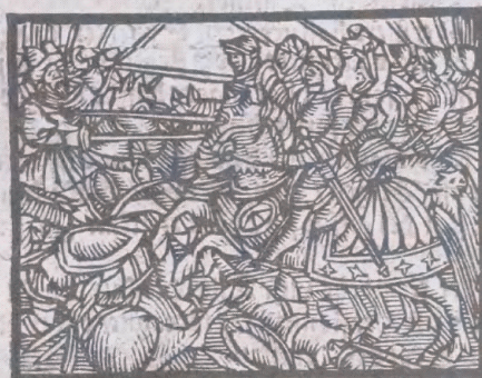
Nyhedsblad fra 1593 med en beretning om de kristnes nylige sejr over tyrkerne. Trykt af Mads Vingaard i København (Det Kongelige Bibliotek).