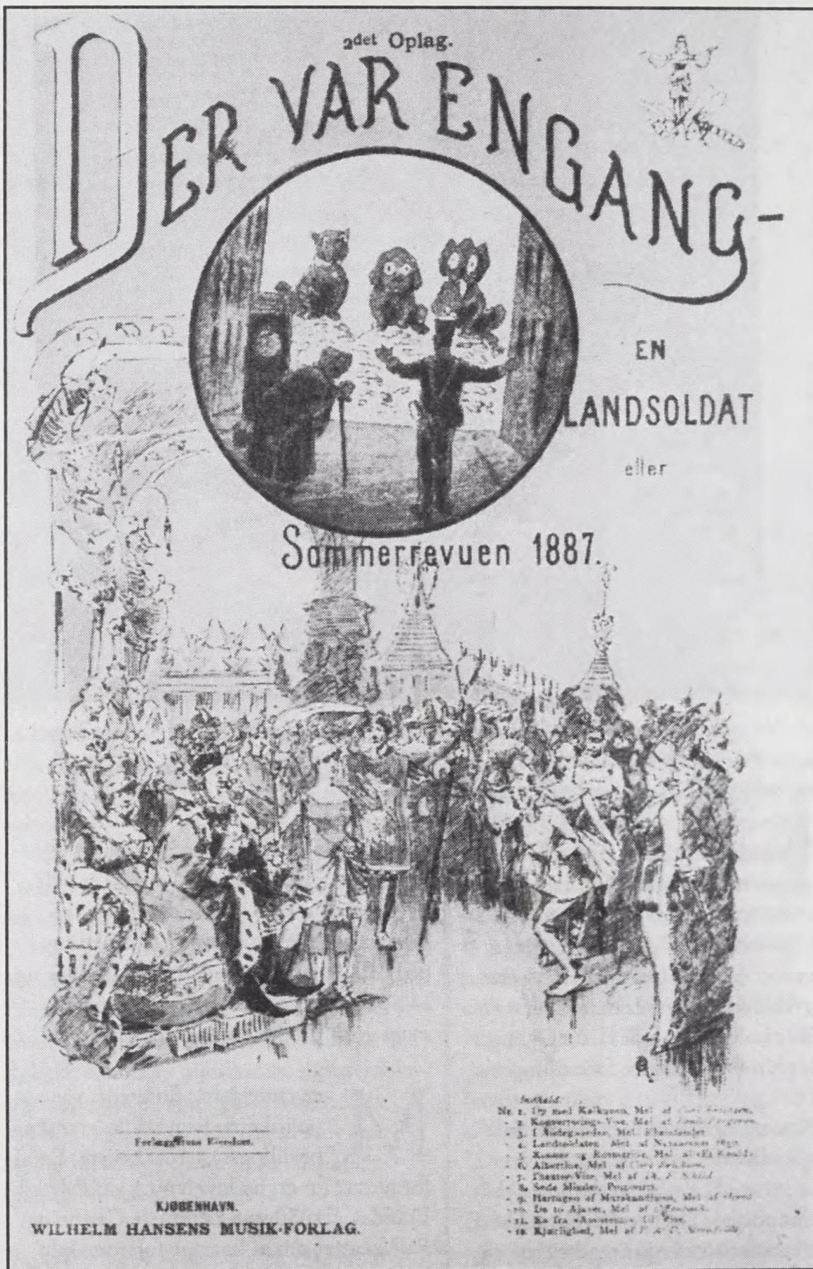
Forside af sangene fra Nørrebro-revuen "Der var engang - en Landsoldat".