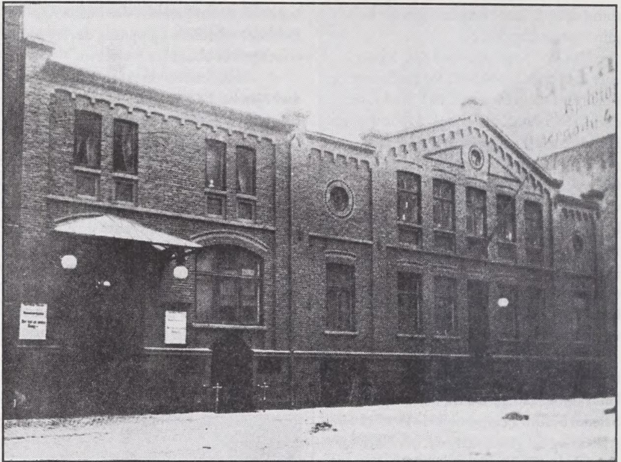
Nørrebro Teater før ombygningen.

kunne få lønforhøjelse på teatret, i stedet fik bevillingen til Morskabsteatret på Frederiksberg. En bevilling han havde til sin død.