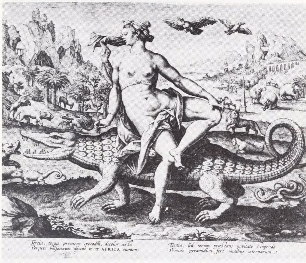
Kobberstik af Adriaen de Collaert (ca. 1560-1618) efter Martin de Vos (1532-1603). Det forestiller "Africa" og indgår i en serie om de fire verdensdele.

fire Verdensdele ser man en række eksotiske dyr såsom struds, løver, dromedarer, elefanter og krokodiller samt en obelisk og en (romersk!) akvædukt grupperet omkring en letpåkædet dame af umiskendelig negroid type. Ser man godt efter, finder man en basilisk lige over krokodillens hovede. Helt åbenlyst er der tale om en beskrivelse af essensen af en verdensdel, således som den blev opfattet omkring stikkets tilblivelse - A. de Collaert levede ca. 1560-1618 og Martin de Vos 1532-1603.