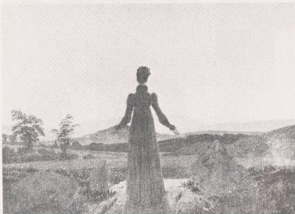
Caspar David Friedrich, Kvinde i aftensol/morgensol, ca. 1818. - Fra kaos og Kosmos.