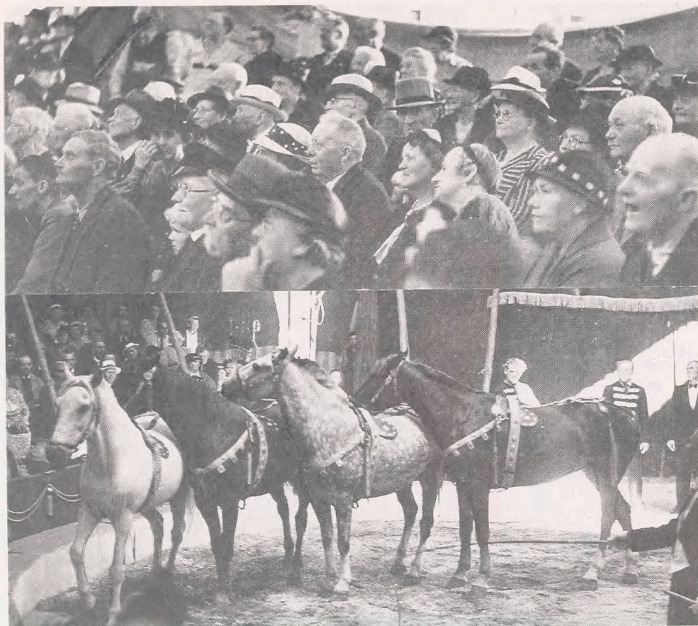
Fra Cirkus Brødrene Schmidt, 25. juni 1941. Teltet var rejst på hjørnet af Parmagade og Amagerbrogade. 800 gamle mennesker fra hele Amager var inviteret til gratis ekstraforestilling.