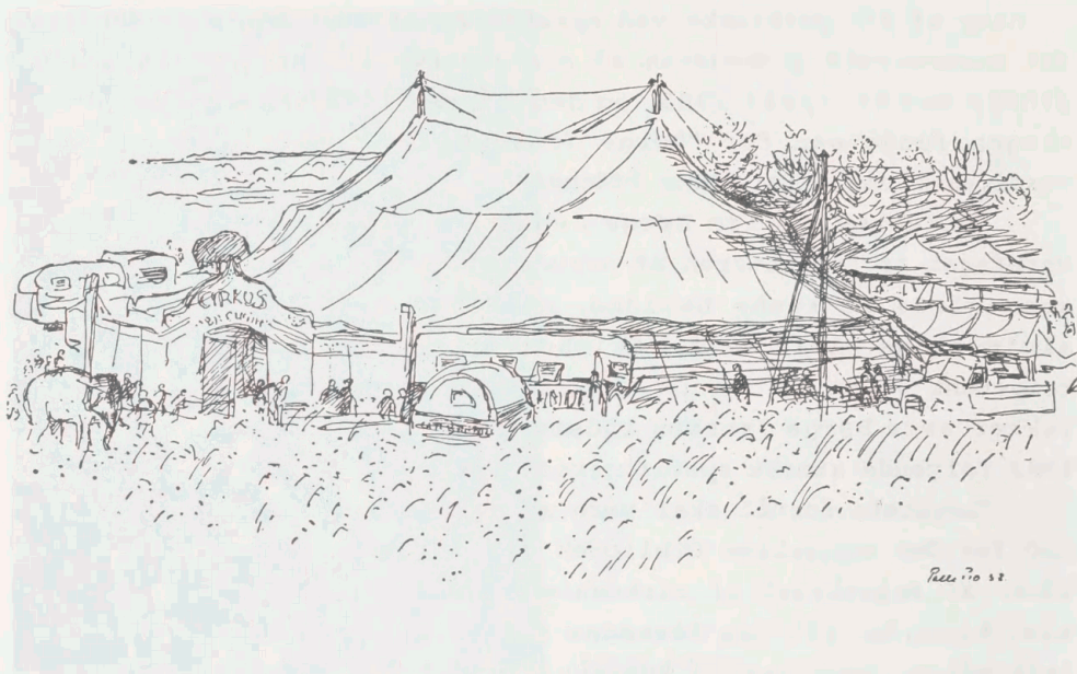
Cirkus Brødrene Schmidt. Tegning af Palle Pio, 1958.

midler at skaffe, da det var realiteternes verden, Børge Jensen interesserede sig for.