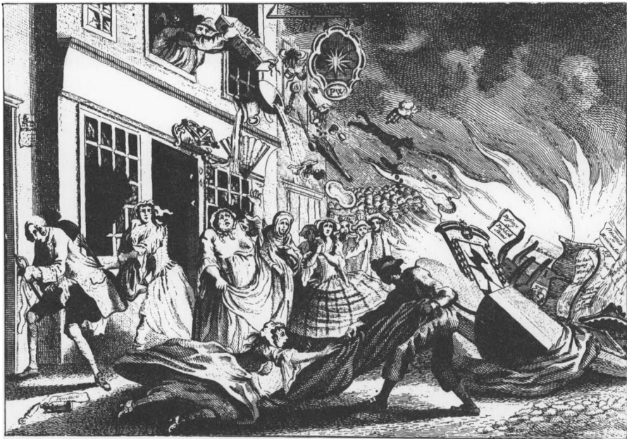
»The Tar's Triumph«. Stik som skildrer en bordelstorm i London 1749. Sammenlign med stikket fra Udfejlsesfesten.

Panelværk, Tapetserier ... intet uden Stenene i Murene bleve staaende« (6).