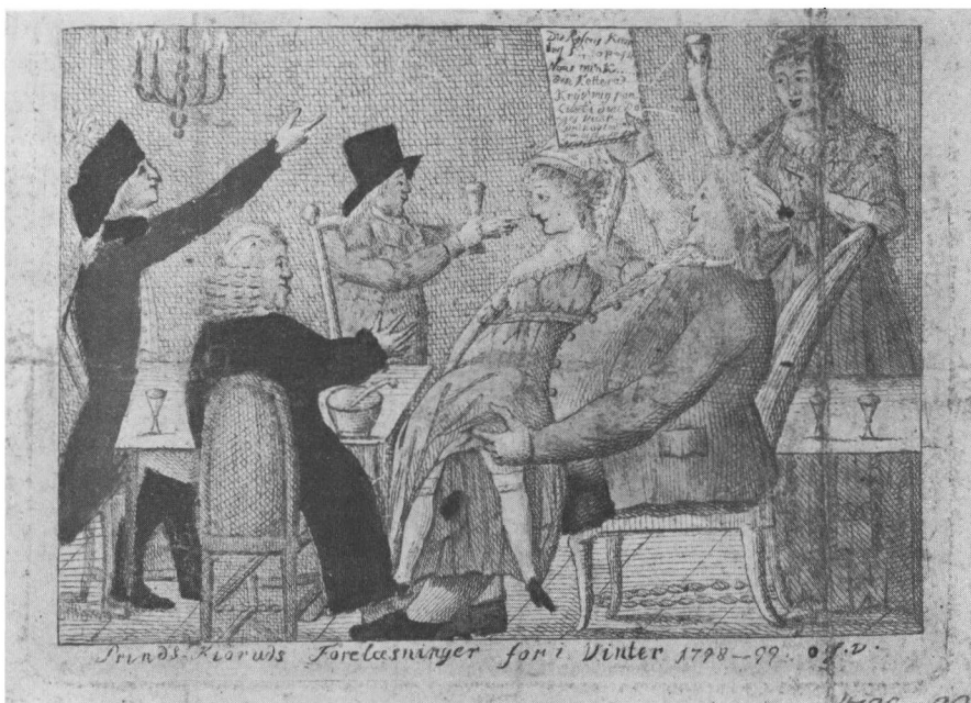
Københavnsk bordelinterieur fra det 18. århundrede.