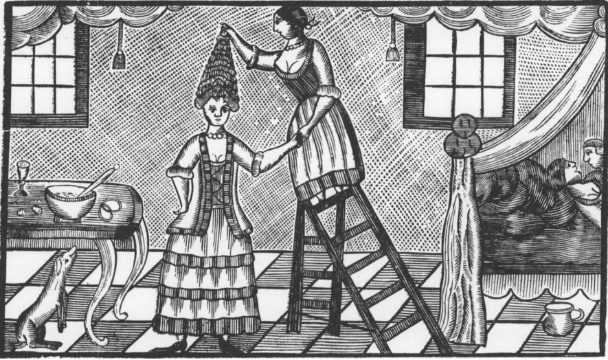
Afbildning paa det store Sørge-Sæt, for Nympherne at bære efter den fordam