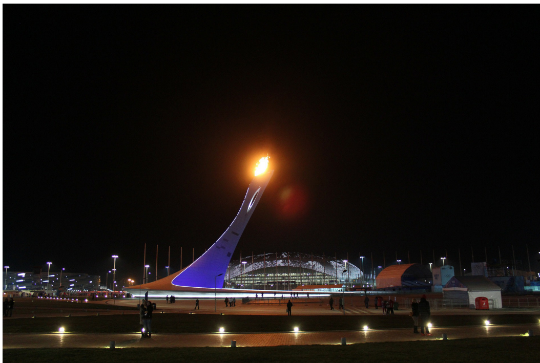
På billedet ses den olympiske flamme ude foran det olympiske stadion Fischt. Der ses her en stærk reference til det russiske rumprogram, da det både ligner en rumraket og henviser til den populære russiske raketvidenskabsmand og pioner inden for rumforskning Konstantin Tsiolkovski.