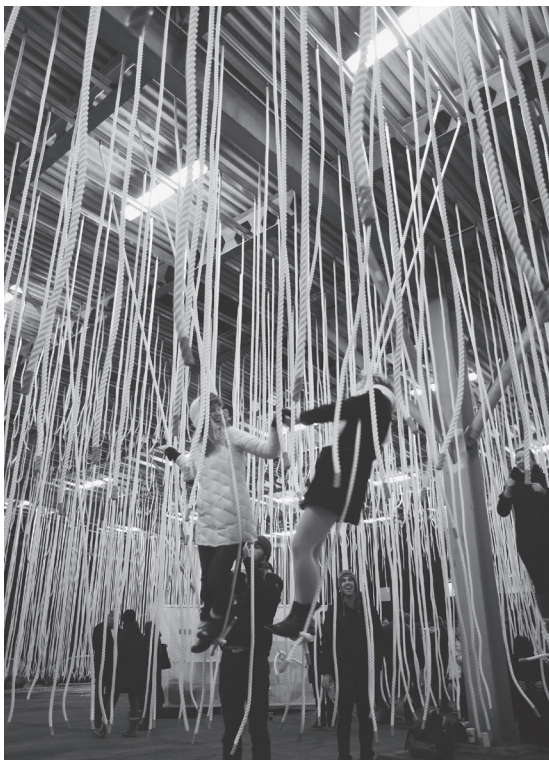
Halvtag med (klatre)reb på Ny Tap Plads.

dre.« Og på baggrund heraf kritiseres det mere specifikt, at der i