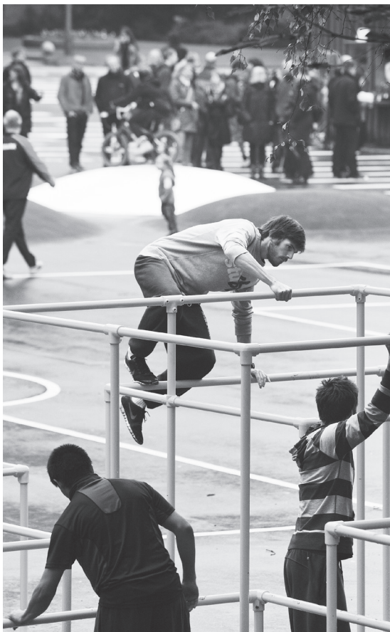
Parkourøvere på Boble Plads.

vinderby i »den kreative tidsalder« (Carlberg og Christensen, 2005, s. 85).