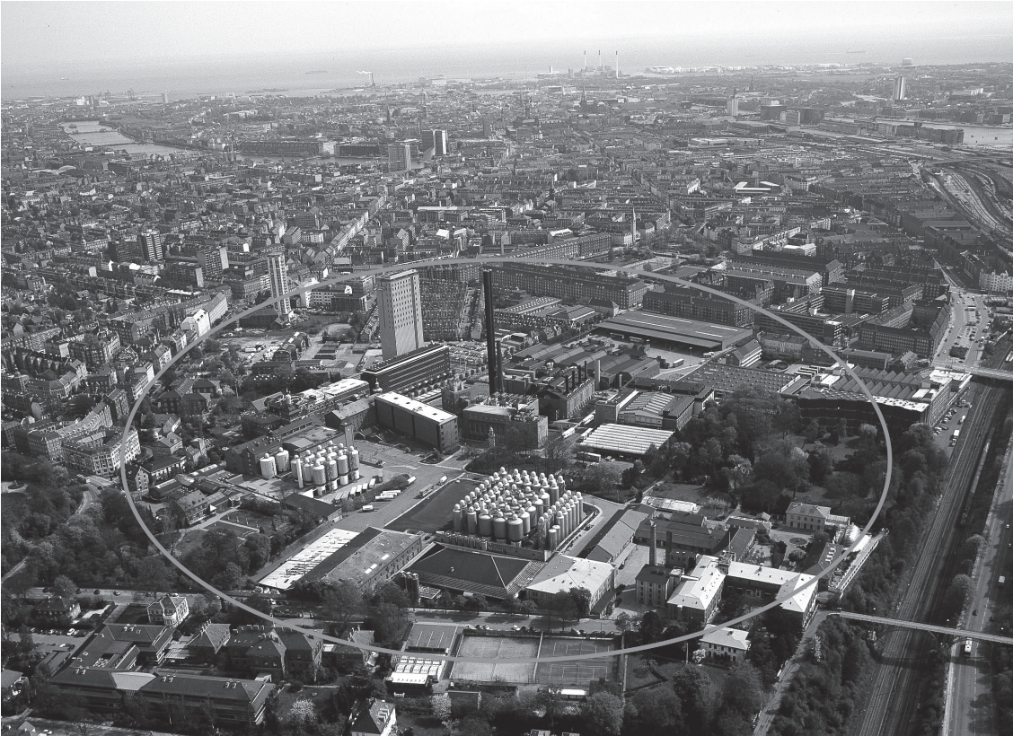
Carlsbergområdet set fra oven.