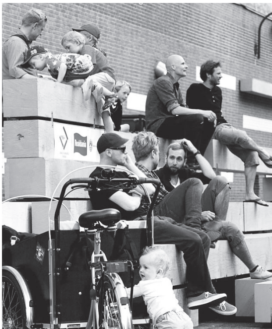
Fædre og børn hænger ud på Tap E Plads.

Kritikken går på, at flygtighedens og fleksibilitetens dominans måske ikke er helt uproblematisk, hvad angår et socialt bæredygtighedsperspektiv. Men hvad siger erfaringerne så her tre år efter, hvor en række utraditionelle (re)kreative tiltag faktisk har været afprøvet? Det kan man læse i en evalueringsrapport udarbejdet af konsulentfirmaet Hausenberg fra 2011.