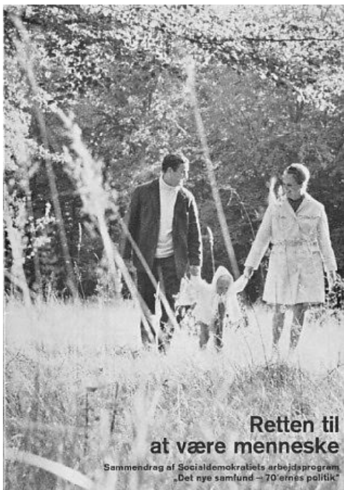
Socialdemokratiets arbejdsprogram 1970

I 1970 ser man på forsiden af Socialdemokratiets arbejdsprogram et foto af et ungt par med deres barn. Manden, kvinden og barnet går med hinanden i hånden i en dejlig skovlysning under overskriften "Retten til at være menneske". Familien, der før i tiden var grundlaget for arbejdsliv og socialisering, er blevet en dekorativ fritidsinstitution, hvor børn og voksne kan hygge sig inden for eller uden for hjemmets fire vægge – eller i alt fald prøve på det!