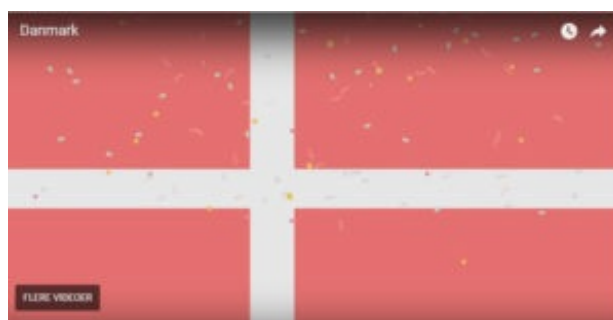
Figur 2: Historiedysten, 2016, Logbogen

Med samme energiske speak og baggrundsrytmer som i den første film, får vi at vide, at Danmark var det første land, der afskaffede slavehandlen, og på billedsiden dækkes hele skærmen et par sekunder af et dannebrogflag, hvor konfetti daler ned over flagdugen til lyden af fyrværkeri.