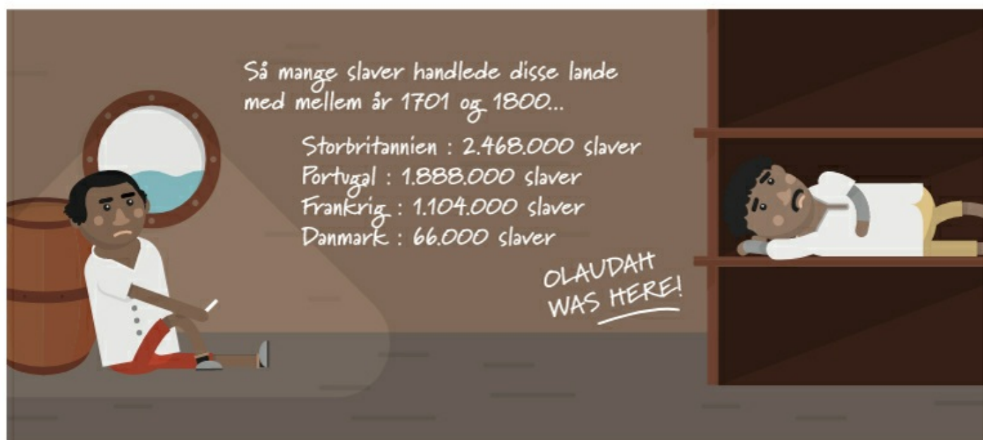
Figur 1 Historiedysten, 2016, Logbogen