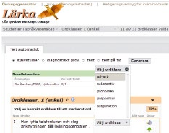
Figur 2: Lärkaövning (ordklasser) för språkvetarstudenter.

Gemensamt för alla övningar är också att meningar väljs från manuellt annoterade eller korrekturlästa korpusar. Använda meningar hamnar i så kallad ”karantän”, och således kan en och samma mening bara dyka upp högst en gång under samma övningstillfälle.