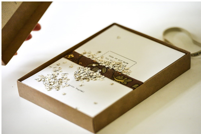
Fig. 1. Ella er mit navn vil du købe det? Af Mette Hegnhøj. Trykt med tilladelse fra Jensen & Dalgaard.

sælges. Ella beskriver, hvordan hun og moren sælger de gamle bøger i "lykkeposer": "Prøv lykken/ sagde mor/ og mente det ikke" (12).