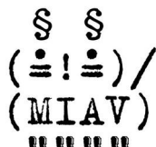
Fig. 2. Typografisk kat. Af Mette Hegnhøj. Trykt med tilladelse fra Jensen & Dalgaard.

Ellas oprør mod antikvariatet bliver manifesteret i værkets materielle og visuelle udtryk, der på flere niveauer gør op med den måde at måde at tænke og læse litteratur på, som den trykte bog og traditionelle bogkultur forbindes med. Teksten er sat op, så der sættes fokus på sprogets visuelle dimensioner, med typografiske billeder, f.eks. af den fødselsdagskage, Ella aldrig fik, af det nul, hun føler sig som og af den mistede kat.