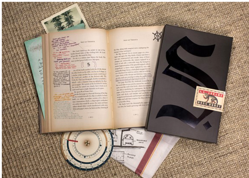
Fig. 3. S. Af J.J. Abrams og Doug Dorst. Trykt med tilladelse fra Mulholland Books.

sere kan udveksle teorier om Straka og hans roman, såvel som personlige erindringer og anekdoter.