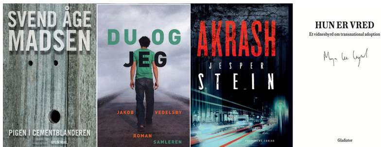
Fig. 1. Forsider brugt i gruppe 1