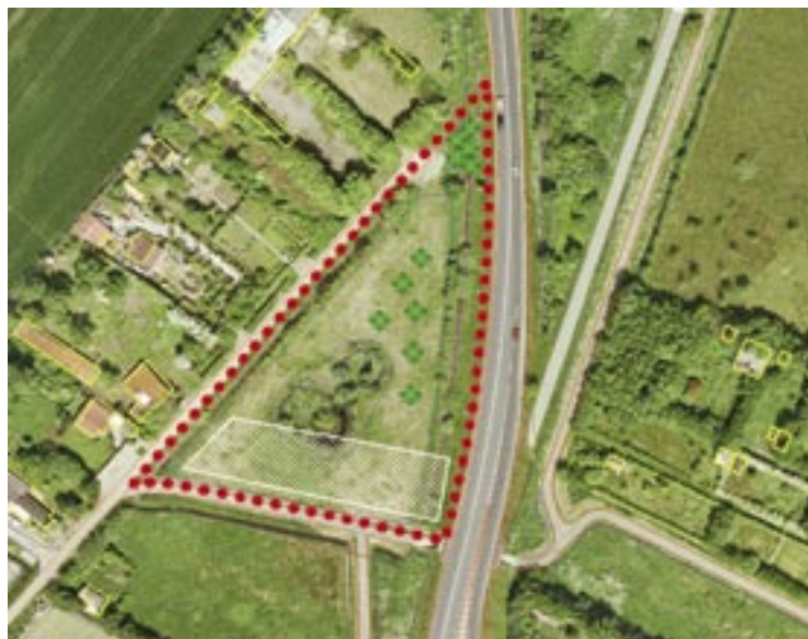
Lokalplanforslag med ortofoto som baggrund

Ofte kan man benytte ortofotoet som et baggrundskort, det er let at orientere sig i. Ved at supplere med andre korttemaer kan man fremhæve og beskrive specielle temaer eller specielle områder. F.eks. kan veje og stier fremhæves, og specielle bygninger