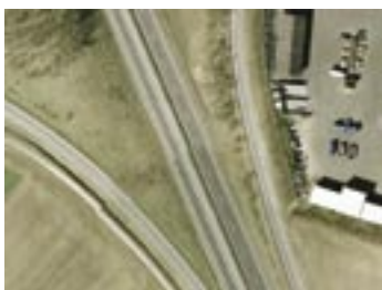
Fejl ved billedsammensætningen i seamline

Ved seamlines skal tværgående elementer som f.eks. kørebaneanter "passe sammen" inden for 3 pixels.