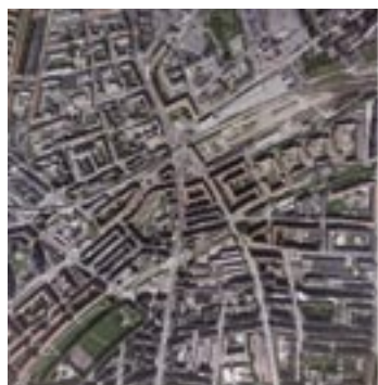
Efter kontrast og farvetilpasning (dodging)

I en mosaik sammensættes flere billeder (ortofotos) til et billede. Sammensætningen sker efter en opskæring i en fælles grænse: Seamlines ( sømlinier ).