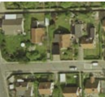
9. maj 2004. Efter løvspring.

selvfølgelig også stor betydning for ortofotoets indhold. Den spektrale sammensætning af det indfaldende sollys samt terrænobjekters spektrale refleksion varierer med årstiden og tidspunktet på dagen. Samtidig har den relative skyggelængde ofte en afgørende indflydelse på identifikationsmulighederne i ortofotoet.