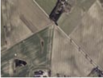
Forår, 4. april 2004