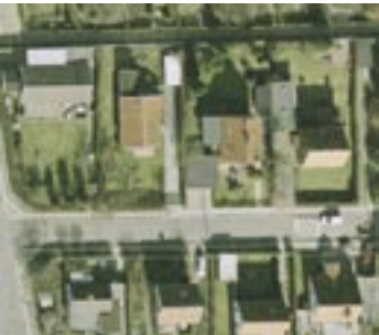
15. marts 2003. Før løvspring, Lange skygger.