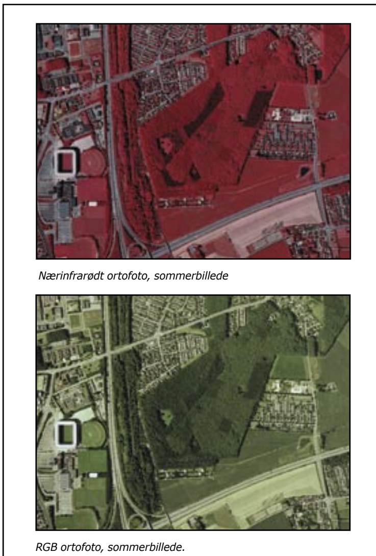
Nærinfrarødt ortofoto, sommerbillede

Ortofotos er blevet en meget væsentlig del af nutidens kortprodukter. Et let læseligt baggrundskort, utolkede informationer, kombinationsmulighederne med andre kortdata, samt en lav pris p.g.a. en forbedret teknik, har medført ortofotos store udbredelse. I mange lande