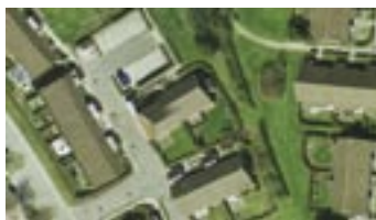
Automatisk genereret seamline igennem en bygning