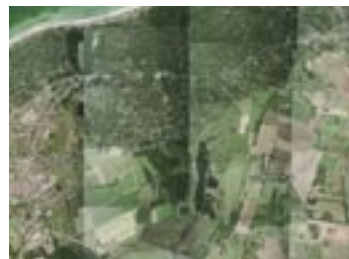
Ortofotomosaik før kontrast og farvetilpasning

ortofoto som baggrundskort og lægger derfor stor vægt på den visuelle kvalitet. Her vil bl.a. resultatet af en god mosaik have stor betydning.