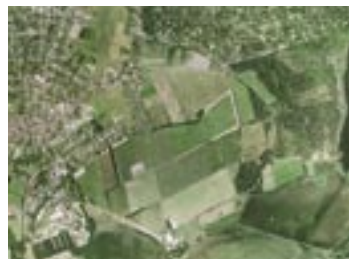
Ortofotomosaik efter kontrast og farvetilpasning

Kravene til de forskellige former for kvalitet har stor betydning for ortofotoets pris. Så afhængig af hvad ortofotoet skal bruges til, kan man vælge at få fremstillet et ortofoto tilpasset ens behov. Dette kan naturligvis være svært med de mange tekniske parametre og valgmuligheder, der indgår ved ortofotofremstilling. Derfor har Geoforum Danmark udarbejdet en "Vejledning om ortofotos", som udkom i november 2004. Den kan frit hentes på Geoforums hjemmeside www.geoforum.dk