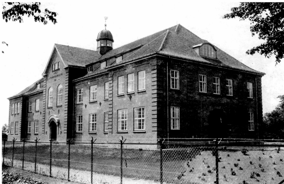
Fig. 2. Landbrugsmuseets nye bygning 1916.

set på opmagasineringen i Lyngby, hvor man brugte bygningerne på Frilandsmuseet til magasiner.