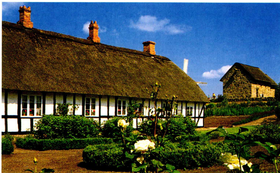
Fig. 7. Hjerl Hede, Præstegården fra Nr. Aarslev. Foto: Poul Buskov, Hjerl Hede, 2001.

plads, men inden projektets afslutning stoppede processen, da der ikke længere kunne opnås offentligt tilskud til brug af ledige bygningshåndværkere.