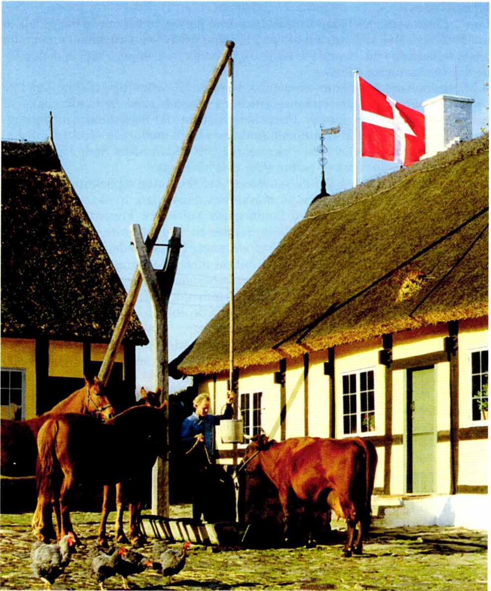
Fig. 8. Melstedgård Landbrugsmuseum nær Gudhjem.