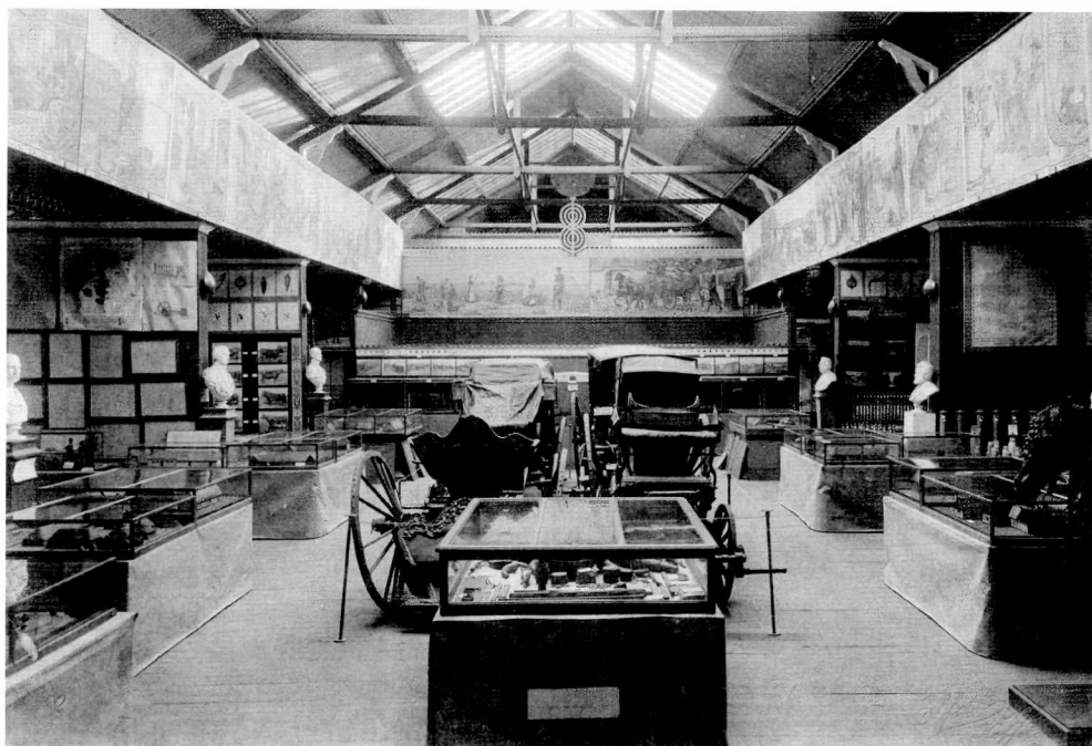
Fig. 3. Interiørbillede fra det gamle landbrugsmuseum.

Opstillingerne på museet og museets filialer ville have glædet Sophus Müller. Opstillingerne var rene studiesamlinger, hvor genstande stod opstillede i rækker efter funktion. For K. Hansen var museet i Lyngby at betragte som et magasin for filialerne, som skulle være de egentlige udstillingsvinduer. Han så derfor gerne, at der blev oprettet flere filialer rundt om i landet.