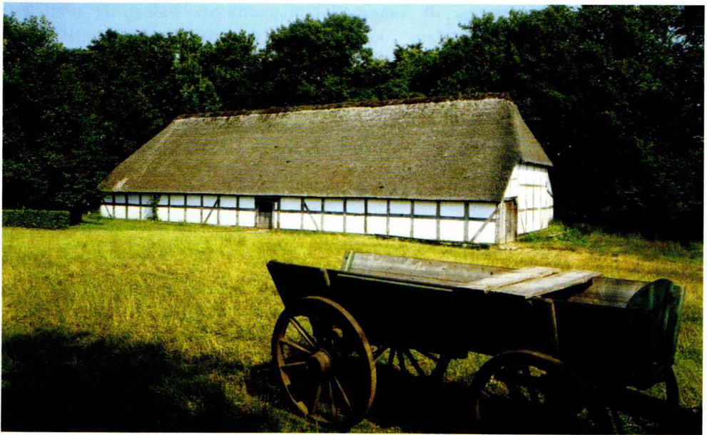
Fig. 6. Hjerl Hede, Agerumsladen fra Als.

genfri, at omfatte en af landets betydeligste samlinger af landbygninger. Det er med betydelige anstrengelser lykkedes museet at samle et stort antal originale bygninger gennem årene, hvoraf flertallet stammer fra Jylland. Samlingen omfatter flere gårde og huse, desuden mejeri, smedje, kro, præstegård, møller og høkerbutik. Af museets bygninger bør følgende fem fremhæves: Agerumsladen, der stammer fra præstegården i Als ved Hadsund. Den er bygget i 1632, og den præcise datering skyldes en indskrift over en dør i ladens sydside, hvor foruden årstallet bygherren Christen Pedersøn Tisings navn er udskåret. Nummer to er smedjen fra Vester Kærby ved Odense, som er en bygning fra midten af 1700-tallet. Dernæst følger landsbykroen fra Skovsgårde ved Bogense fra ca. 1750. Foruden kro rummede bygningen høkerbutik, hvilket ikke var usædvanligt i 1700-tallet. Nummer fire er præstegården fra Aarslev syd for Randers, som er dateret til 1661. Gården består af stuehus og to udhustlænger, hvoraf den ene stammer fra præstegården i Verring ved Randers. Og endelig må vi også nævne mejeriet fra Mandø, opført 1897. Mejeriet er indrettet med tidens maskiner og er fuldt funktionsdygtigt.