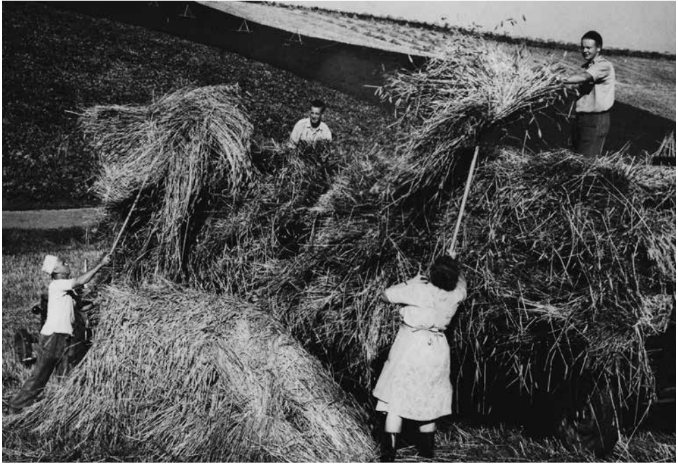
Figur 8: Kvinderne har altid bidraget med en væsentlig del af arbejdskraften på landet. Især ved det store manuelle arbejde før mekaniseringen hjalp alle til, som på dette høstbillede omkring 1960 med læsning af neg på Lilåsgård i Odsherred.

også vigtigt; der er ikke længere tale om et standardlån i kreditforeningen, men om valg af både lånetype og om, hvorvidt lånet skal være i kroner, euro eller schweizer franc. Blik for nye afgrøder og driftsformer skader heller ikke.