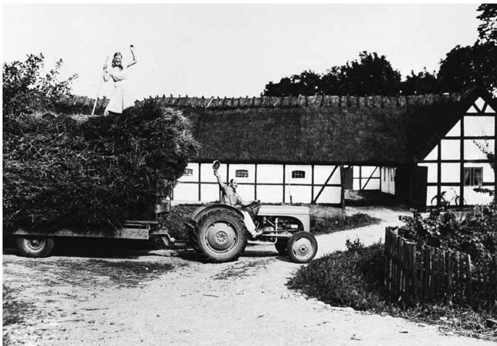
Figur 3: Den lille grå Ferguson blev symbolet på landbrugets mekanisering og ikonet for fremgang for de mange selvstændige familiebrug efter Anden Verdenskrig (Foto: Dansk Landbrugsmuseum, Gl. Estrup).

Om dette skal sammenvejes til noget positivt eller negativt afhænger nok i høj grad af både tid og sted. Det må huskes, at denne bondekultur med andelsbevægelse og Venstre kun strakte sig over godt et halvt århundrede fra sidst i 1800-tallet til sidst i 1950'erne. Og det var en meget urolig periode med både 1. og 2. verdenskrig og en økonomisk turbulent mellemkrigstid, der kulminerede med 1930'ernes store depression. Der var utvivlsomt også stor forskel fra egn til egn. I visse egne var der mange store godser og mange løst ansatte landarbejdere – "herregårdsbørster" – uden udsigt til at få eget brug; her var klassemodsætningerne tydelige. I andre egne var der mange små gårdmandsbrug og husmænd, men få eller næsten ingen herregårde, og her kunne landsbyen mødes på nogenlunde lige vilkår i forsamlingshuset, kirken og landsbyskolen.