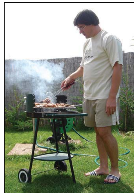
At indtage jord med 3 mg tjære/kg eller spise en grillbøf er lige farligt.

Kriteriegruppen fik til opgave at kigge på,