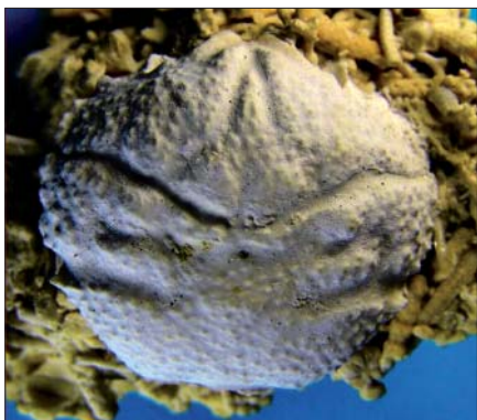
Krabben Dromiopsis rugosa - den mest almindelige krabbe, som mange har fundet på fossiljagter i Faxe Kalkbrud.

I denne lille bog, som forfatterne selv kalder for et "billed-atlas", har vi mulighed for at nyde dele af den omfattende samling af fossiler fra Faxe Kalkbruds lag af koralkalk og bryozokalk. Fossilerne er dels bevarede skaller og skeletdele af calcit og dels aftryk i den hårde kalksten efter nu opløste (især snegle-) skaller. Forfatterne har fremstillet siliconegummi-udfyldninger af disse huller, således at vi nu ser snegle- og muslingeskallerne, som de oprindeligt så ud. Disse afstøbninger er af fotograferingstekniske grunde blevet pudret med det gulligbrune limonit-pulver. I billed-atlasset bringes omkring 200 virkelig gode fotografier, hvoraf