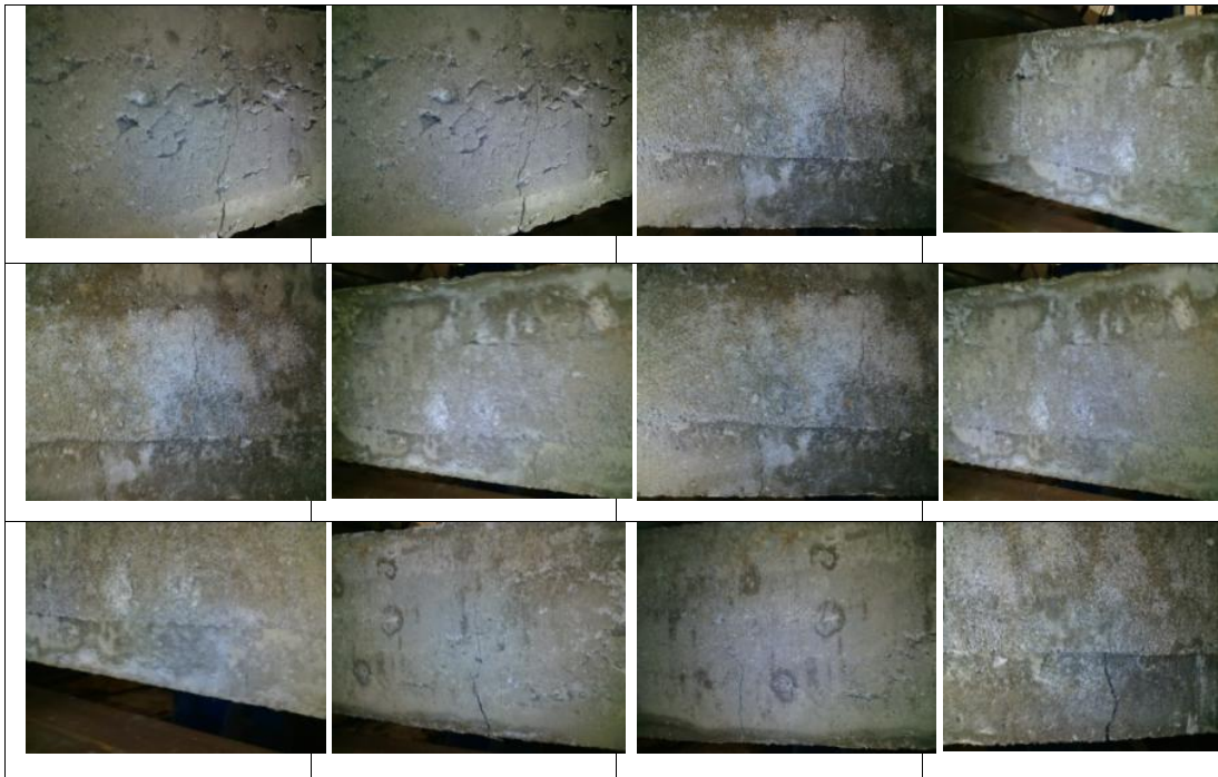
Gambar 3. Foto-Foto Hasil Pengujian