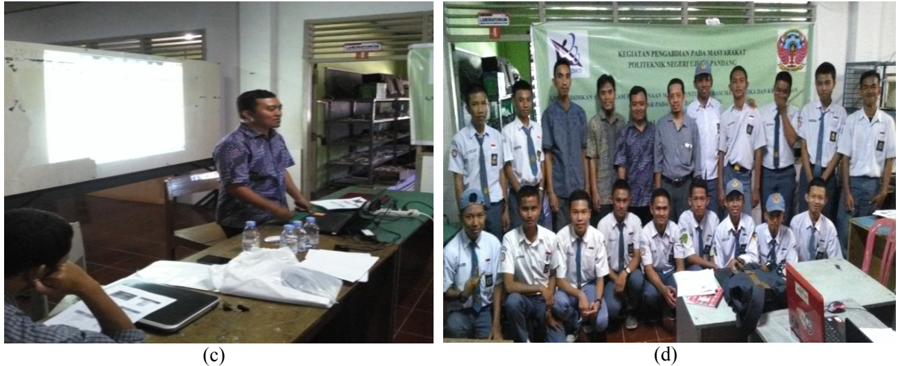
Gambar 2. Pelaksanaan kegiatan pelatihan penggunaan MATLAB