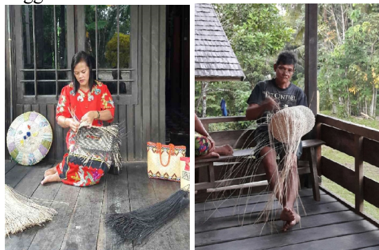
Gambar 2. Kegiatan pemberdayaan masyarakat Kampung Tende sebagai pengrajin

Berdasarkan hasil pemetaan pada kegiatan Doktor Mengabdikan Universitas Brawijaya tahun pertama, Kampung Tende memiliki banyak potensi khususnya potensi alam. Hal ini tercermin dengan pemanfaatan hasil alam sebagai sumber penghasilan warga sekitar. Sebagian besar warga di Kampung Tende memanfaatkan hasil alam untuk dimanfaatkan menjadi berbagai komoditas seperti kerajinan tangan. Sebagian besar masyarakat Kampung Tende khususnya ibu-ibu bekerja sebagai pengrajin anyaman dari rotan ( Gambar 2 ) untuk dijadikan berbagai produk seperti tas, topi, kotak pensil, dan gantungan kunci ( Gambar 3 ). Untuk tetap menjaga konsistensi dan kontinuitas hasil produksi, kegiatan ini berada dibawah naungan koperasi "Lampung Abadi" yang dikelola oleh para anggota PKK Desa.