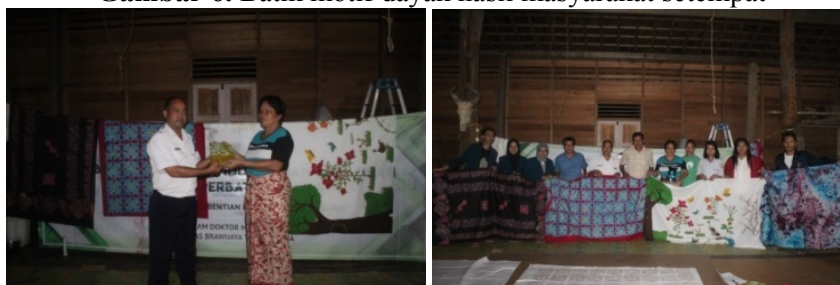
Gambar 7. Antusiasme pemerintah setempat dan masyarakat dalam pembuatan produk batik motif dayak