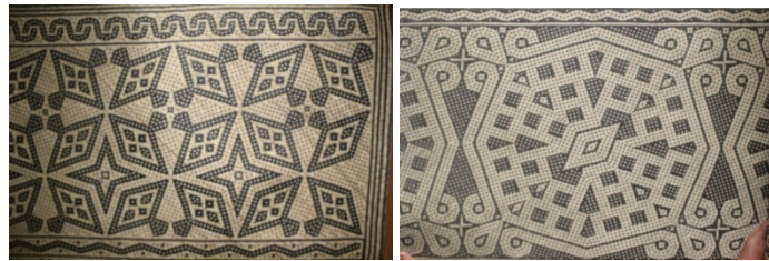
Gambar 4. Motif khas dayak

kerajinan dengan ciri khas motif Dayak Kampung Tende (Gambar 4). Kerajinan ini sudah banyak dikenal oleh masyarakat luas sebagai produk khas Kampung Tende. Oleh karena itu, tim pengabdian berinisiatif untuk memanfaatkan kekayaan alam yang ada di Kampung Tende sehingga bernilai tinggi dan mampu berperan meningkatkan dan menambah penghasilan masyarakat Kampung Tende.