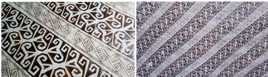
Gambar 6. Batik motif dayak hasil masyarakat setempat