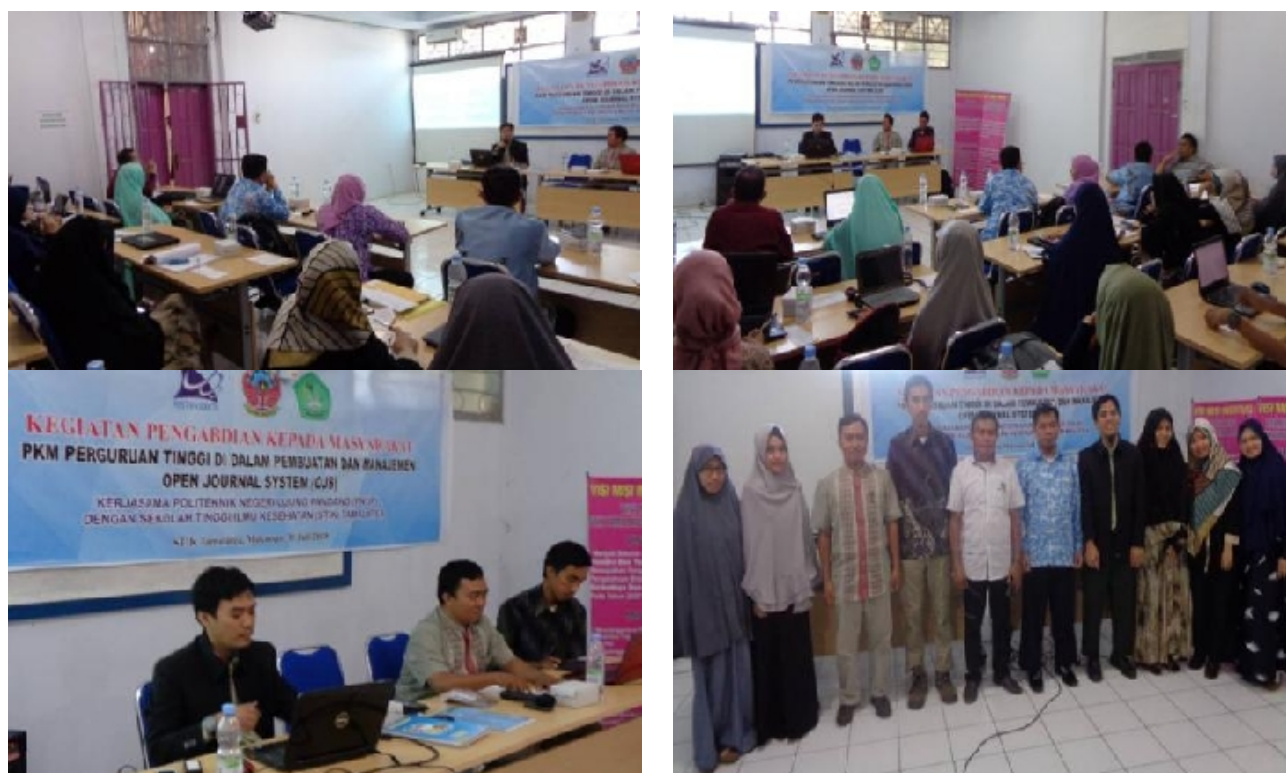
Gambar 2. Foto-foto kegiatan PKM

Kegiatan pengabdian ini juga diikuti dengan penuh antusias dari peserta sehingga peserta berharap agar ada tindak lanjut bagi pengembangan jurnal di Institusi mereka dalam bentuk kerjasama lain yang lebih intensif. Beberapa foto-foto pelaksanaan kegiatan dapat dilihat pada gambar 2.