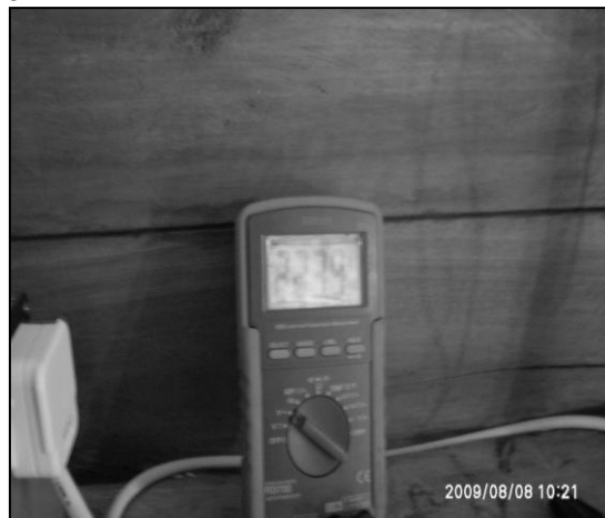
Gambar 2. Pembacaan tegangan luaran inverter

Pengumpulan dan analisis data dilakukan pada lokasi penelitian yaitu dilakukan secara langsung dengan cara mengukur tegangan keluaran pada masing-masing peralatan, dan diketahui bahwa pada peralatan sel surya menghasilkan tegangan luaran sebesar 24 Volt demikian pula pada turbin angin menghasilkan tegangan luaran sebesar 24 Volt. Perlu diketahui bahwa untuk melakukan sistem hybrid pada dua buah peralatan dibutuhkan tegangan luaran yang sama oleh karena itu pada modul sel surya dibuatkan hubungan seri sehingga tegangan luarannya menjadi 24 Volt. Inverter menghasilkan tegangan luaran sebesar 220 Volt seperti yang diperlihatkan pada gambar 2.2 dibawah ini: