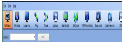
Gambar 2. Memilih Fitur NetWatch

Masukan ip address ( ip address server ) atau domain name yang dituju, tentukan besar paket data yang akan dikirim dan akan didapat statistik seperti berikut ini.