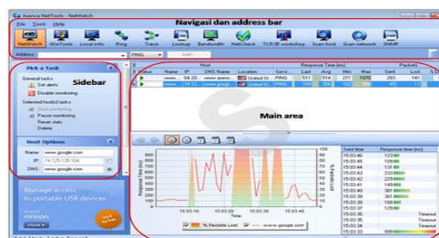
Gambar 1 : Axence netTools 4.0 Pro

Dalam Penelitian ini pengukuran dilakukan menggunakan software Axence NetTools 4.0 Pro . Aplikasi tersebut merupakan aplikasi untuk menguji konektivitas pada sebuah jaringan dengan cara mengirimkan paket data ke server yang dituju.