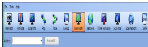
Gambar 5. Memilih fitur Bandwidth

Untuk pengukuran Troughput , Pilih fitur bandwidth lalu masukkan ip address atau domain name .