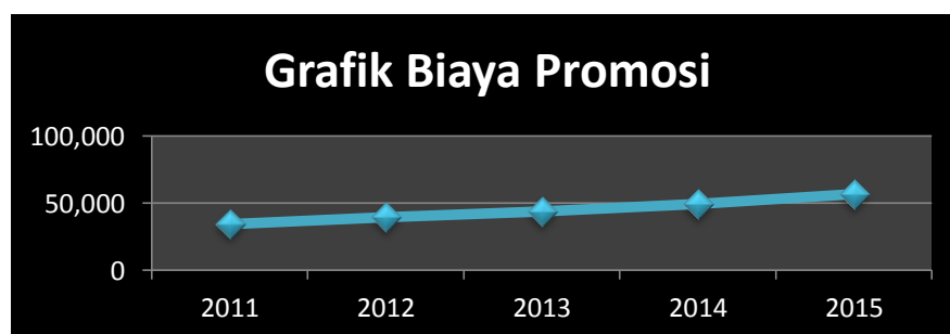
Biaya Promosi Penjualan PT. Toyota Hadji Kalla Makassar Periode 2011 – 2015

Sumber data : PT. Toyota Hadji Kalla (data diolah 2016)