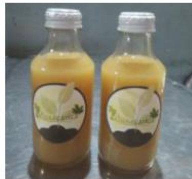
Gambar 3. Pupuk Musacarica

Pupuk Musacarica memiliki dua keunggulan yang pertama sebagai penyubur tanaman, dan kedua sebagai pembasmi hama. Pupuk Musacarica sebagai penyubur tanaman karena mengandung ekstrak batang pisang, ekstrak batang pisang tersebut kaya kandungan unsur hara yang dibutuhkan oleh tanaman dalam proses pertumbuhan. Selain itu, ekstrak batang pisang juga mengandung mikroba pengurai bahan organik yang bertindak