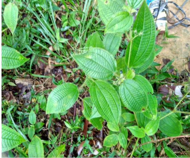
Gambar 2. Seduduk lanang ( Clidemia hirta )