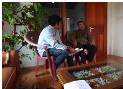
Gambar 2. Kepala Desa Pesisir Bukit

bermata pencarian sebagai petani pada waktu itu masih pulang pergi dan belum menetap pada daerah pertanian mereka, karena mereka memiliki rumah yang jauh dari areal pertanian. Sehingga masyarakat pada saat itu belum menetap. Masyarakat di Kecamatan Gunung Tujuh menganggap bahwa mata pencarian petani merupakan penopang dalam pemenuhan kebutuhan hidupnya semenjak turun temurun dari orang tua mereka, sehingga apabila masyarakat tersebut di gusur dari lahan pertanian mereka berharap pemerintah menyediakan lahan lainnya sebagai ganti ladang mereka. Masyarakat pun bersedia pindah dari lokasi mereka sekarang apabila pemerintah menyediakan lahan ganti bagi ladang mereka. Berikut di bawah ini merupakan dokumentasi wawancara peneliti pada saat di lapangan.