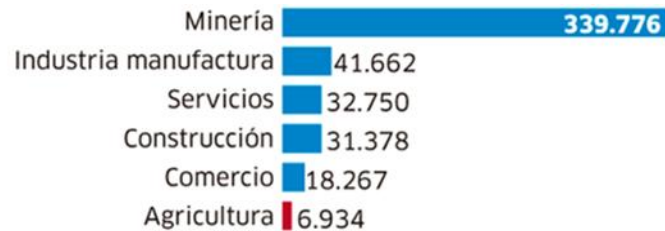
Figura 2. Productividad laboral 2017

en el año 2017), tenemos la obligación funcional de estudiar el problema y plantear modelos alternativos para mejorar la productividad en la industria de la construcción en el Perú.