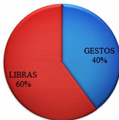
Figura 1: Gráfico de porcentagem da opinião dos professores relacionada a forma de comunicação mais usada pelos alunos surdos.

Quando os professores foram questionados sobre a forma de comunicação que eles acreditam que seja a usada pela maioria dos surdos (figura 1), obtivemos o resultado que podemos observar no gráfico que mostra em forma de porcentagem a opinião dos professores que participaram da pesquisa.