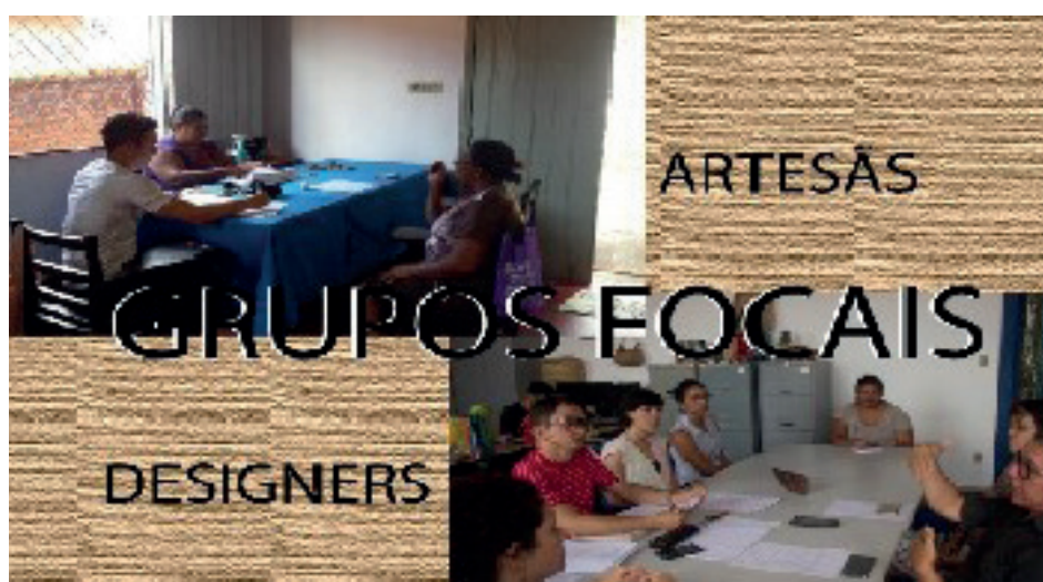
Figura 02 – grupo focal com artesãos e consultores

A outra sessão do GF aconteceu em São João dos Patos, com as bordadeiras da AMAC, onde entendemos, através dos discursos das artesãs, como elas lidam com as tendências de moda trazidas pelos consultores, as inspirações que elas buscam na internet, de forma geral, e suas próprias criações, baseadas em histórias de vida.