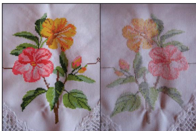
Figura 1 - Bordado frente e verso

Apresentamos como relevante, característica da relação dos designers com as artesãs da AMAC, o resgate, no sentido mais amplo da palavra, e, em específico, dos gráficos tradicionais aplicados à técnica “ponto cruz”, e na elaboração de produtos com “elevado padrão de qualidade”. O termo entre aspas é para pensarmos o que significa a “qualidade superior” do trabalho que essas mulheres tanto enaltecem quando falam do avesso de seus produtos. No decorrer deste trabalho iremos refletir sobre esse questionamento.