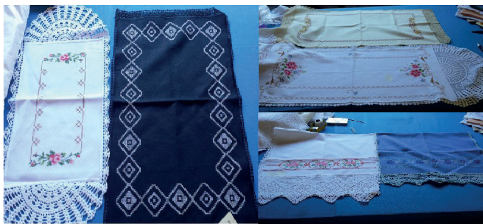
Figura 04: bordados tradicionais X bordados da coleção marcando bordados em cores

A exposição “Marcando Bordado em Cores” foi realizada no espaço “Dona Sula”, localizado no Centro da cidade de SJP, onde estiveram presentes autoridades como prefeito, vereadores e empresários locais, além de familiares, amigos e apreciadores do ofício de bordar. O evento teve o patrocínio de lojas de móveis, onde foi montado ambientes específicos para serem expostos os produtos artesanais de cama, mesa e banho.