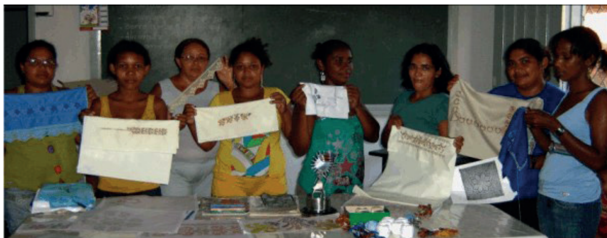
Figura 05: bordadeiras da AMAC expondo seus produtos

O evento aconteceu no mês de maio de 2011, com assessoria e organização de designers e uma turismóloga/consultora em Gestão de Empreendimentos Artesanais, além do talento das bordadeiras da AMAC. Essa exposição mostrou o trabalho das artesãs de São João dos Patos, por meio de produtos como guardanapos, almofadas, toalhas, jogo americano e outros.