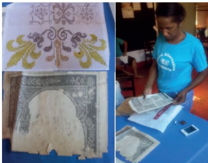
Figura 03: gráficos de bordados restaurados

O resultado final do projeto foi apresentado em uma exposição de alguns produtos alcançados ao longo dos trabalhos desenvolvidos em parceria com assessores do SEBRAE. Além de facilitar a assessoria, o SEBRAE possibilitou a aquisição de matéria prima para confecção dos produtos. Esse processo de preparação para o evento apresentou como principal característica o resgate de gráficos tradicionais aplicados à técnica “ponto cruz” na elaboração dos produtos. Ver na Figura abaixo: