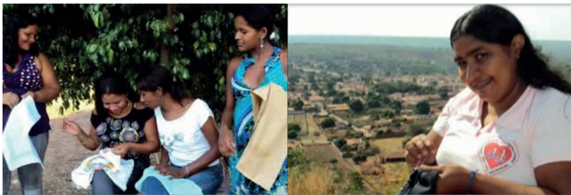
Figura 06: bordadeiras da AMAC em ensaio fotográfico