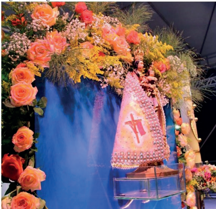
Figura 1- Imagem de Nossa Senhora de Nazaré em São Luís – MA.

A comitiva paraense ficou impressionada com a devoção dos maranhenses à Virgem de Nazaré e declarou que entre todas as capitais visitadas aqui foi a maior e mais bonita acolhida à imagem. Prometeu então enviar de presente a recente criada Paróquia Nossa Senhora de Nazaré, bairro do Cohatrac, uma réplica da imagem da virgem de Nazaré (Figura 1) que se encontra em Belém, além de propor a realização anualmente do Círio de Nazaré na cidade de São Luís.