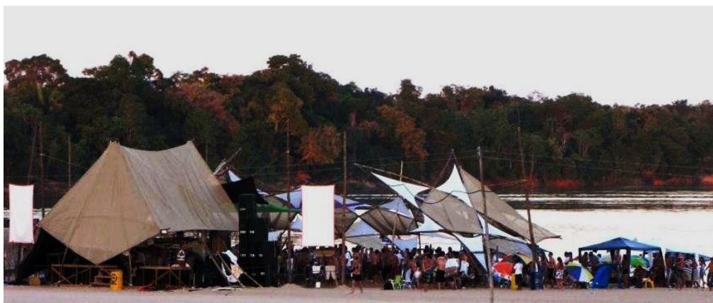
Figura 6 – Ilha dos Botes - Festival Fora do Tempo.

A partir de 2005, o município passou por transformações em relação à quantidade de atrativos, outros espaços adquiriram novas funções em decorrência do crescimento da atividade. Pequenos proprietários que viviam da agricultura e criação de animais perceberam a vocação de suas propriedades para o turismo e investiram em pequenas estruturas para atender os visitantes, dentre eles, destacam-se a Cachoeira do Dodô, Recanto da Família, Cachoeira Aldeia do Leão, Cachoeira do Ilia, Balneário Queda D'água, Recanto das Águas, dentre outros.