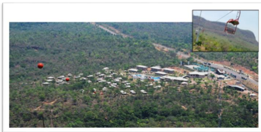
Figura 4 – Complexo da Pedra Caída visto a partir do teleférico.

Nos anos de 1990, construíram chalés para hospedagem; em 2006, o complexo foi comprado pela Empresa Pipes e tornou-se o principal atrativo de Carolina, aspecto consolidado devido ao modelo de gestão empregado com investimentos altos em infraestrutura. Em 2014 foi injetado um capital para melhoria de instalações no valor de R$ 25 milhões, o que teve como consequência o aumento nos custos para visitação (MARANHÃO, 2017) (Figura 4).