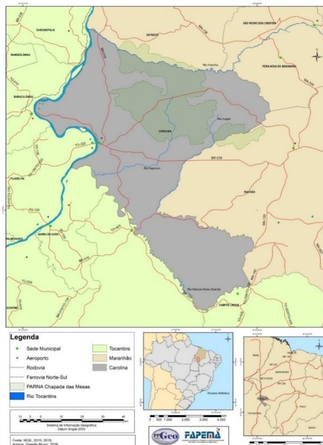
Figura 1 – Localização Carolina-MA.

Elevada à categoria de cidade em 1859, pela Lei Provincial nº 527, seu território possui uma área de 6.441,603 km 2 . O município se limita ao Norte com os municípios de Estreito, São Pedro dos Crentes e Feira Nova do Maranhão; ao Sul e a Oeste com o Estado do Tocantins; a Leste, com o município de Riachão (IBGE, 2016) (Figura 1).