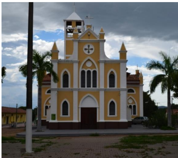
Figura 2 – Igreja de São Pedro de Alcântara, Carolina-MA.

do Decreto nº 12.954 de 12 de fevereiro de 1993, preservando e valorizando os seus 500 imóveis de características históricas importantes (Figura 2) (SILVA, 2015). Recebeu ainda o título de Paraíso Ecológico, oriundo de suas especificidades ambientais, atribuído pela Prefeitura de Carolina.