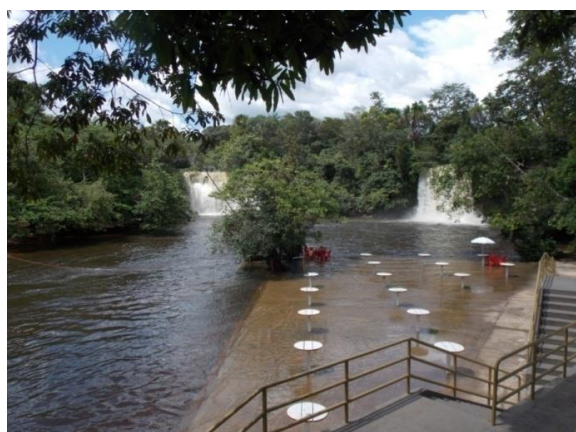
Figura 3 – Complexo Cachoeiras do Itapecuru.

A atividade turística nas Cachoeiras do Itapecuru iniciou-se nos anos de 1980, devido à abertura de uma estrada de acesso ao povoado São João da Cachoeira, no qual está localizado o atrativo. A área particular adotou a visitação para fins turísticos com serviços de bar e restaurante em construção de taipa. Em 1997, o atual proprietário comprou a área e iniciou as obras de implantação de infraestrutura que levariam ao conjunto de serviços de hospedagem e alimentação que apresenta nos dias atuais (Figura 3).