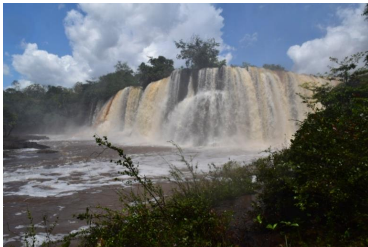
Figura 5 – Cachoeira do Prata, Carolina-MA.

Em 2012, foi inaugurada a Usina Hidrelétrica de Estreito – UHE no rio Tocantins, no ano anterior foi concluído o enchimento do reservatório da UHE, com uma área inundada de 400 km 2 , que atingiu os municípios de Estreito e Carolina no Maranhão, Aguiarnópolis, Babaçulândia, Barra do Ouro, Darcinópolis, Filadélfia, Goiatins, Itapiratins, Palmeirante, Palmeiras do Tocantins, Tupiratins no Tocantins (CESTE, 2017).