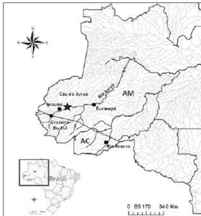
FIGURA 04 – Localização dos seringais no Sudoeste Amazônico.

Consoante Abreu & Nunes (2012, p. 22), a região inicial dos seringais está situada no sudoeste do estado do Amazonas no município de Ipixuna, próximo à fronteira com o Acre, entre as coordenadas 6°50'S e 71°15'W. Ocupa uma área de cerca de 3.000 hectares, recoberta pela Floresta Pluvial Amazônica, sendo uma região riquíssima em distintos ambientes, por exemplo igapó, terra firme, várzea, três grandes lagos e inúmeros igarapés.